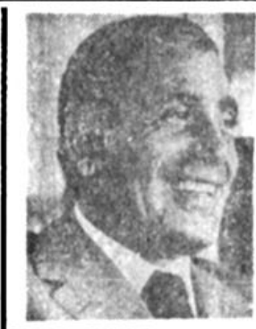
از: حسین هیگل