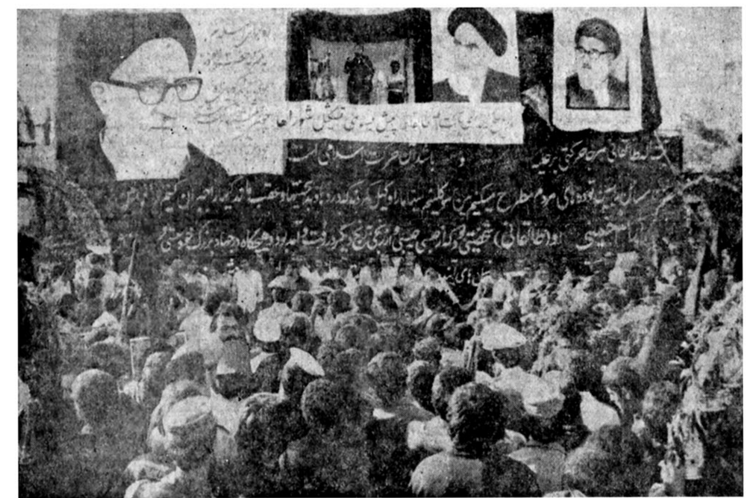
مراسم و مجالس یادبود، در تهران و شهرستانها ادامه دارد

دستجات سوگواری بر سر و سینه زنان از تهران تا بهشت زهرا پیاده روی کردند مردم، خاک بر سر می‌ریختند و وضه می‌زدند در صفحات ۲-۱۲