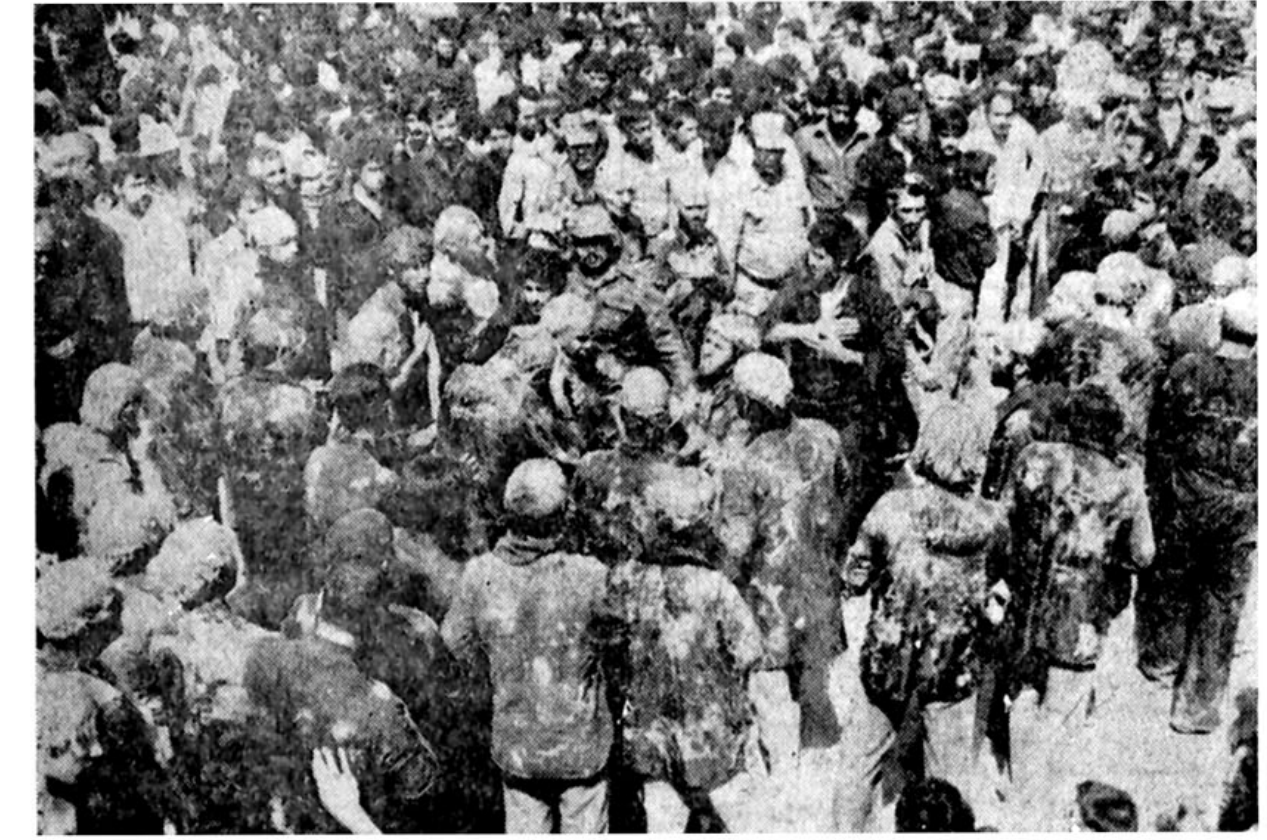
میلیونها تهرانی و سوگواران شهرستانی، در مراسم سوگواری حضرت آیت الله طالقانی، خاک غرا بر سر کردند.