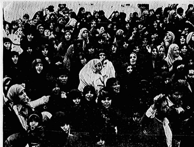
● صحنه ای از تظاهرات عظیم و غرور آفرین ۱۵ دی، مقابل جاسوسخانه امریکا، تهران. ● زنان با کودکان خویش در آغوش آمده بودند تا از امام، رهبر انقلاب و از خط او دفاع کنند.

بدنیاال حوادث پریروز تبریز، دیروز عدای از هواداران حزب جمهوری خلق مسلمان که به قفه و چاقو و چماق مسلح بودند، با شعار «بازار باید ببندد»، در محوطه بازار، دست به تحریک و حادثه آفرینی زدند. اینان در بازارچه به هر مکانی که عکس امام خمینی را بر دیوار نصب کرده بود، حمله ور شده و عکس را پاره میکردند. گروه دیگری از اینان در ساعت ۱۲:۳۰ در جلو میدان دانشسرا، راه را برانگیزیدند و پسته و پرویشان شاد را بر زمین، (آیت الله حنی، نماینده امام خمینی در تبریز است)، می نوشتند. این عمل در خیابانهای دیگر نیز تکرار شد.