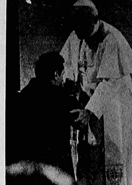
بوسه بلو الواسه رهبر اتحادیه همبستگی بردنهای لهستانی

* اشاره «اشاره اشعل الظالمین بالظالمین...» جمله انگلیسی آکونومست با این عبارت «ملت کرسته می تواند رهبران کشورش را بخورد» از اوضاع اقتصادی لهستان و همبستگی کلیسا و اتحادیه همبستگی سخن گفته است. این عبارت رقیقا در مورد انگلستان سفق می کند، آبانیه بعد از مملکت معروف بگرو خوست، اما در سرزمینهای اروپای شرقی، آکونومست با اوضاع اقتصادی انگلیس بازیدیک ۳۰ میلیون نفر یکبار دیگر کوربوی و عشقانه رکنین یهودیان قائل نموده است. نظامهای شرقی و سرمایه داری اقتصادی قادر به حل مشکلات کرستیست، اما این نکته نیز در خود توجه است که گشترتای غربی، سائلی چون بحران اقتصادی لهستان را در بوق می کند. گزاردن و از فزایع انگلیس چیزی نمی بینند و همبستگی طلیواعت شرقی هم درباره انگلستان سکوت می کنند. نوشته مجله انگلیسی آکونومست درباره اوضاع لهستان می آید: «ملت کرسته می تواند رهبران کشور را بخورد...» این شعار است که بزودی پیش از صدم آلبومس، لاکسی کاکامیون که برای ۵۰ ساعت راهزنی مرگ شپس روزشورا سسود کرده بود، نوشته شده بود. این نظرات رسایل نقلیه روز چهارشنبه هفته گذشته پس از دو ساعت اعتراض سراسری در شهر ورشو پایان یافت. اعضا یات ورشو به دیگر شهر های لهستان نیز کشیده شد و در نتیجه نظرات علیه سفهای طویل جیره بندی های غذایی شرکت گشت. گشت ۲۰ دیرسد از جیره گوشت دریا و ابرج و طرحهای دولت در ماه های جاری گشترتای افزایش ۴۰۰ درصدی برای مواد غذایی از اساسی ترین لایسل اعتصاب کنندگان بود. پس از گذشت یکسال از قابل دولت و اتحادیه همبستگی، نظرات بخاطر گرسنگی که این نظرات مهم خیابانی لهستان ششاد می رود. اتحادیه کارگری بعنوان اعتراض در مورد کمیود