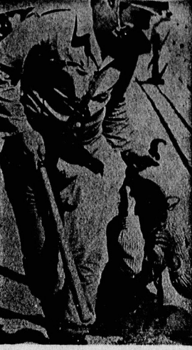
بازمزدور کشف اسرائیلی بوهای بلاد دختر فلسطینی را گرفته و اورا بر زمین می‌کشد، این نوعی های کوچکار جنایات رژیم اشغالگر قدس علیه مردم فلسطین و مستعطف فلسطین است.