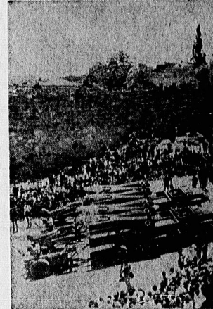
انگلیسیا مهمترین زیارتگاه مسلمانان بین المللیست که به پیوسته و آمریکانها با موشکها و تجهیزات نظامی خود از صهیونیستها حمایت میکنند سالگرد استقلال خود را جشن بگیرند.

اسرائیل درحالی که با دفاع آمریکا جوشش رو شده است، حملات خود به جنوب لبنان را در روز جمعه ۱۷ جولای ادامه داد، و با بمباران بیروت ۲۰۰ تن را به هلاکت رساند و ۸۰۰ تن را زخمی کرد. بمباره خسارات غیر قابل صنی موارد ساخت آمریکا درحالی که مجدداً یکسکند بگردن جهانی تحت الحماهای اسرائیل موجه شده بود، تحویل ۴ هواپیمای قلی باغاله ۱ هواپیمای جت دیگر را که طبق برنامه قرار بود بزودی