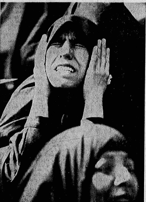
دیروز انگار دوربینها و عسرها هم از تاباننده بود. طول جمعیت را مگر می توانست در آن غوغای شگفت کشف کنی و در نگاه دوربین آری. تنها هلی کوپتر های تلویزیونی تآدای توانستند. آخر، دربارا در کوزه های مگر می توان ریخت ؟ بقیه در صفحه ۲