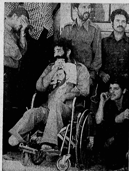
دیروز انگار دوربینها و عسرها هم از تاباننده بود. طول جمعیت را مگر می توانست در آن غوغای شگفت کشف کنی و در نگاه دوربین آری. تنها هلی کوپتر های تلویزیونی تآدای توانستند. آخر، دربارا در کوزه های مگر می توان ریخت ؟ بقیه در صفحه ۲