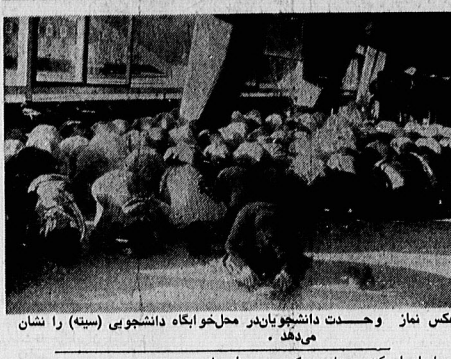
عکس نماز وحشت دانشجویان در محل خوابگاه دانشجویی (سینه) را نشان می‌دهد.

پیرامون پناهندگی سیاسی بی‌صدر و جوی به فرانسهدیگر همبستگی هایشان (قسمت اول) فرانسهدیگر همبستگی هایشان (قسمت اول) فرانسهدیگر همبستگی هایشان (قسمت اول)