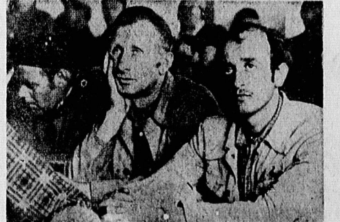
کارگزارانی که چشم به دهان بلو الواسه دوختند

نخست وزیر فرانسه نیز قول ارسال مواد غذایی به لهستان را داده است