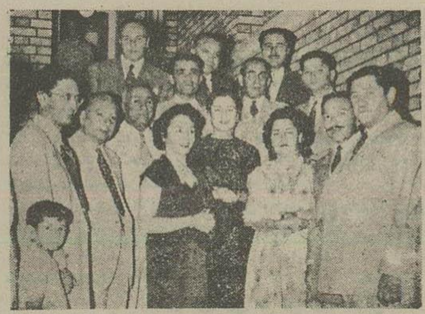
در این عکس آقای شیخ محمد اکرام در میان جمعی از مدعوین، در ضیافت منزل آقای عرفانی دیده می شود

آقای شیخ محمد اکرام معاون وزارت اطلاعات و انتشارات پاکستان که چند روز پیش بنظور مطالعات فرهنگی به تهران وارد شده بود دیروز با هواپیمای بانفان آقای عرفانی وابسته مبلوعماتی سفارت پاکستان در تهران بهست شیراز عزیمت نمودند و قراقراس روز پنجشنبه (فردا) به تهران بازگردند.