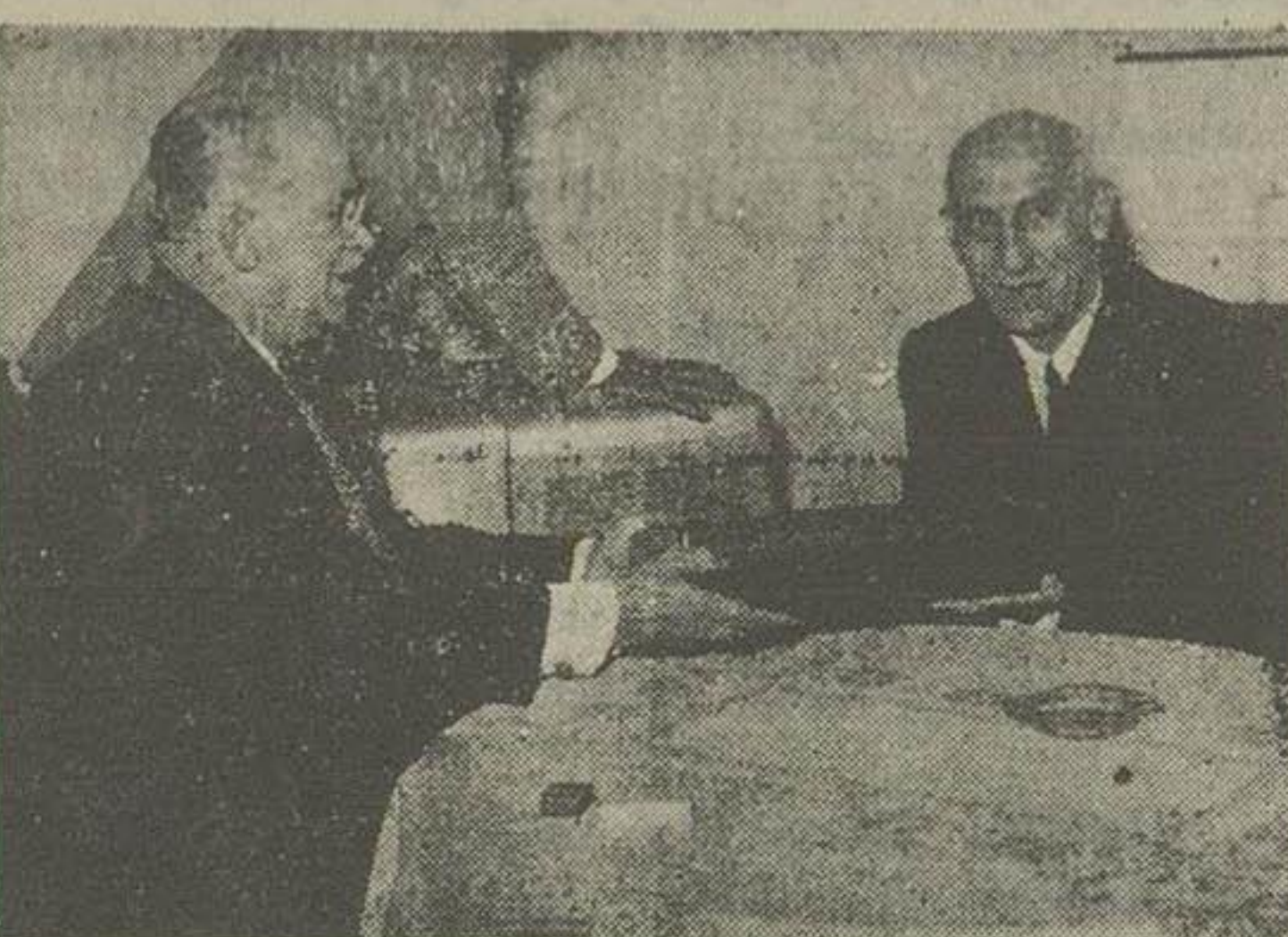
ساعت ۶ بعد از ظهر دیروز آقای بهاء الدین نوری وزیر مختار عراق در منزل آقای نخست وزیر حضور بهم رسانیدند و یک جلد کلام الله مجید با نامه محبت آمیزی از آقای نوری سید نخست وزیر مسابق عراق بایشان اهداء نمود.