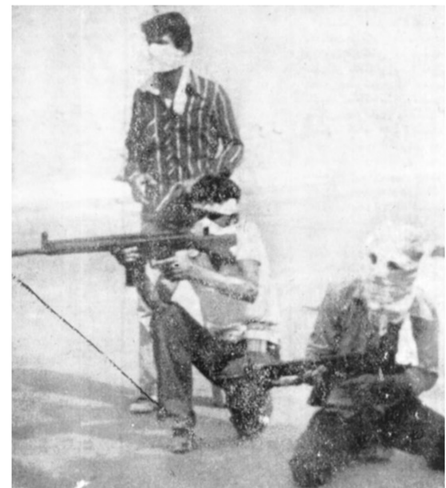
خیابانهای خرمشهر، دیروز به صحنه جنگ خونینی تبدیل شده بود و در گوشه و کنار شهر از این صحنه ها بیشتر چشم میخورد

مکرم سنجابی، رهبر جبهه ملی ایران بعد از ظهر دیروز در جمع گروه کثیری از دانشجویان و جوانان هوادار جبهه ملی ایران بیرون موقت کنونی خرمشهر و اوضاع تاریخی ۲۵ سال اخیر سخنان مشروحی ایراد کرد. سنجابی، در سخنانش شدیداً حزب توده ایران، را مورد حمله قرار داد و از روش این حزب در جریان کودتای ۲۸ مرداد، انتقاد کرد. دکتر سنجابی، در سخنرانی مفصل و یک ساعت و نیمه خود گفت: انقلاب مسا از بسیاری جهات با شکو و تراف انقلاب کبیر فرانسه و انقلاب اکثر روسیه می باشد. وی آنکه به جنایات و جهانگشایی های خونبار آمریکا و انگلیس در آسیا و آفریقا اشاره کرد و غارت های گسترده آمریکا را در جهان برشمرد. دکتر سنجابی آنکه از سبوطه یاد کرد و ضمن مطرح کردن مسائلی ملی شدن نفت از پیش داشت و دارد.