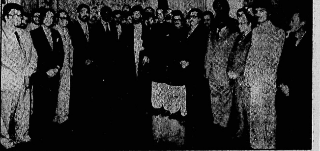
دیدار با سفرا و کارداران

حجت الاسلام سیدعلی خامنه ای رئیس جمهوری اسلامی ایران عصر پرویز در اجتمع سفرا و کارداران کشورهای اسلامی که به میزبانی میلا در سعادت حیات حضورت ممدین عبدالله (م) بدعوت وزارت امور خارجه در محل