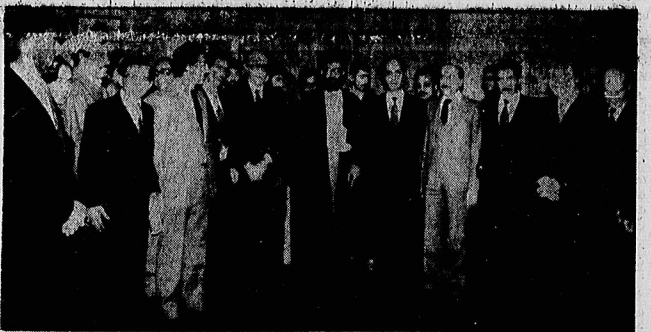
دیدار با سفرا و کارداران