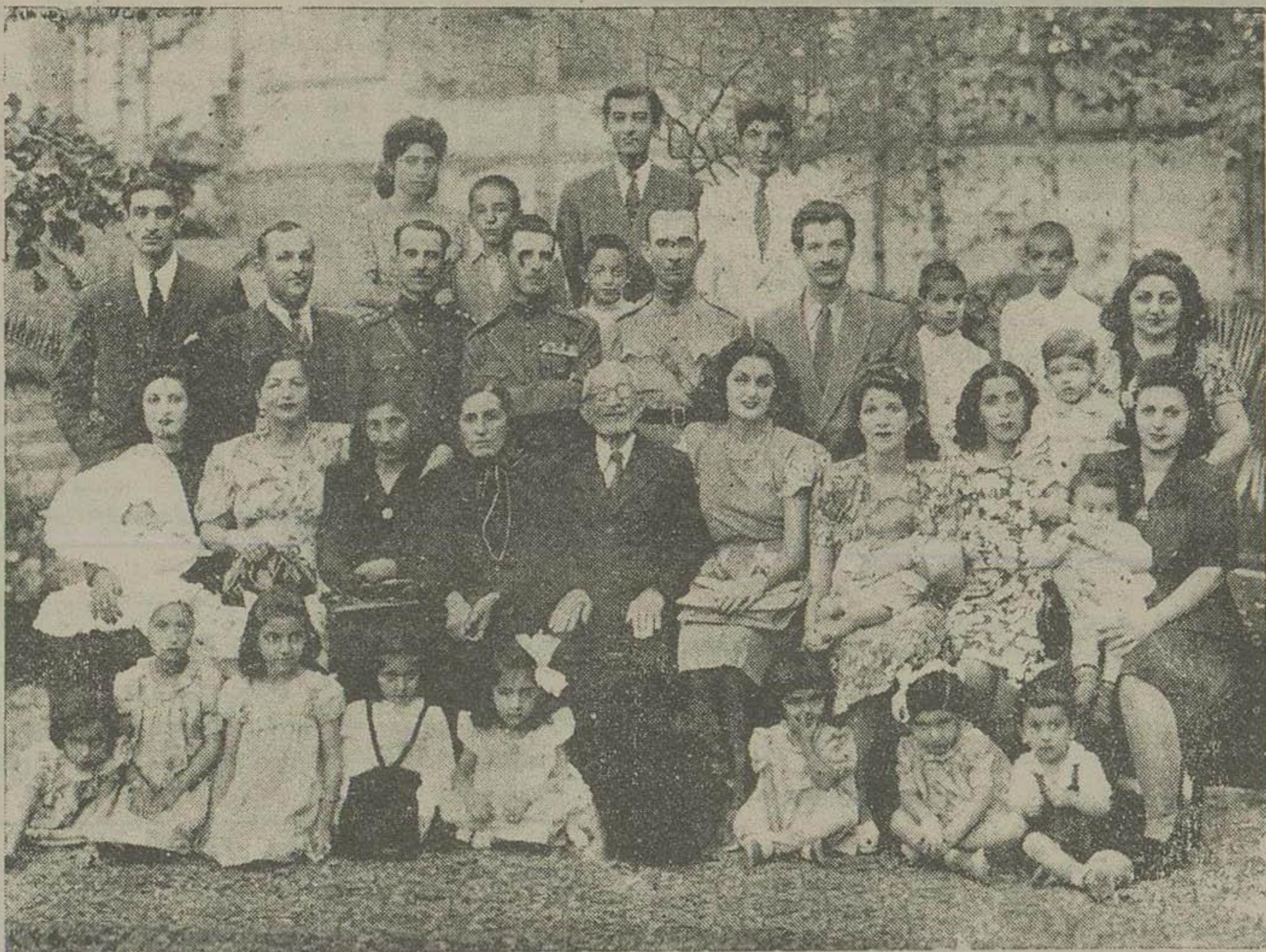
آقای مصدق روز ۱۵ آذر ۱۳۲۹ پدر ۹۰ ساله نخست وزیر در وقت ۹ قوت بخش دین هکس دیده میشوند. رزم آرا در آزمون سر لشکر بود و در این هکس او و آقایان سرتیپ رزم آرا و سرتیپ رزم آرا و مهندس رزم آرا و منوچهر رزم آرا و همچنین خواهرانش دیده میشوند آقای مصدق رزم آرا پدر مرحوم رزم آرا در وسط نشسته و دختران و همسرهای و نوادگان او در کنارش قرار گرفته اند