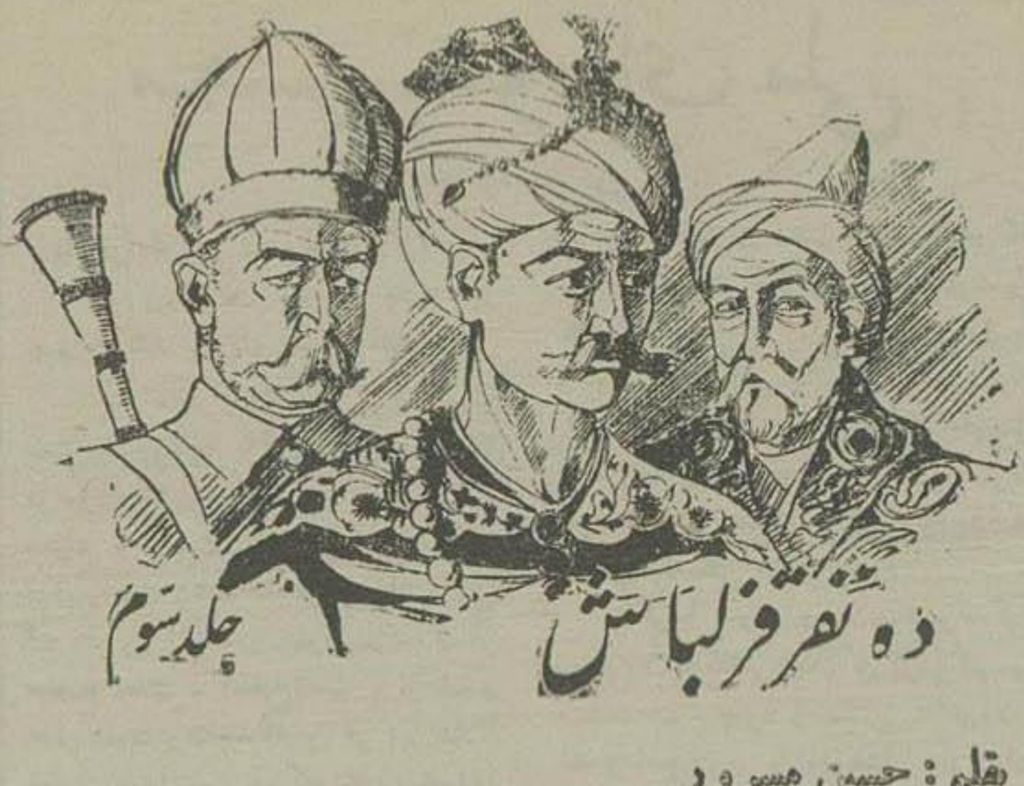
دو نفر از باستان

بیشتری لازم می باشد و اشکالات زیادتری در راه نیل بقصد بوجود خواهد آمد.