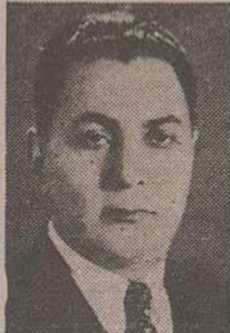
دکتر سنجابی قاضی اختصاصی ایران در دیوان لاهه