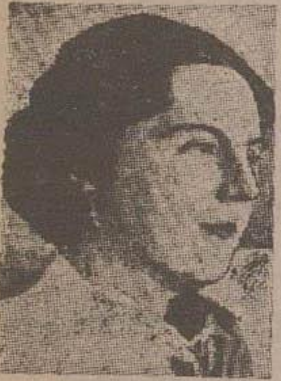
علیا حضرت ژولیا نا