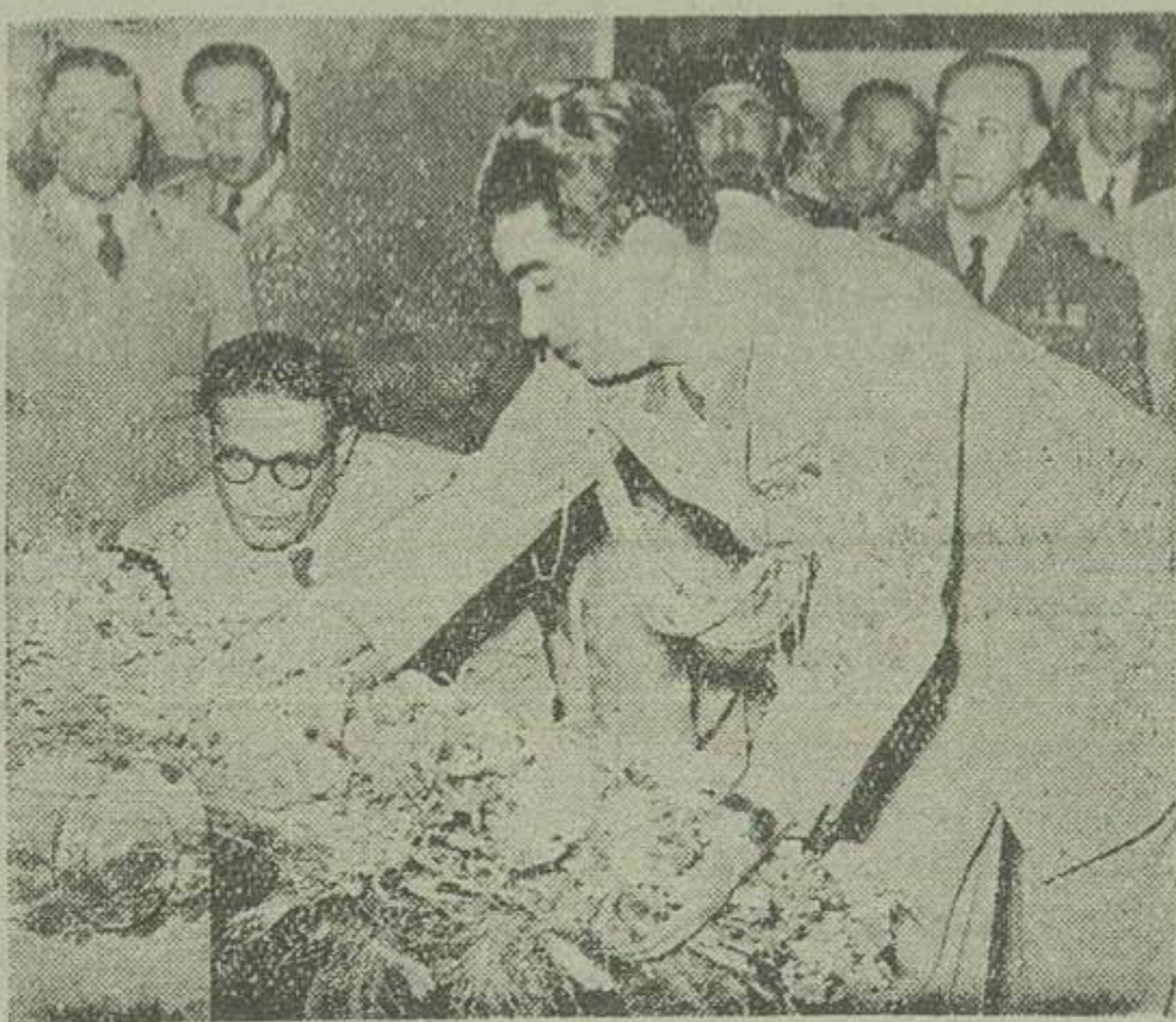
الا حضرت شاهپور غلامرضا پهلوی بر آرامگاه اعلیحضرت فقید تاج گل نثار میکنند. چند تن از افسران ارتش نیز در عکس دیده می شوند. بناسبت صاف دیروز باشهین آرامگاه مخصوص آن اعلیحضرت صورت سال تدفین جنازه شاهنشاه فقید رسمی در بقیه در صفحه پنجم

دیروز مراسم مفصلی در آرامگاه اعلیحضرت فقید برگزار گردید والا حضرت شاهپور غلامرضا تاج گلی نثار آرامگاه کردند