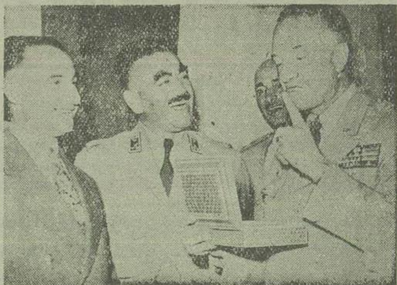
ژنرال «ترودو» در ضیافت باشگاه افسران هدیه ای را که از وزیر دفاع ملی دریافت داشته است مشاهده میکنند. درست چپ وی آقایان سرلشکر باتناقلیچ رئیس ستاد ارتش و سررتیب فرزانتان و وزیر پست و تلگراف دیده میشوند. ساعت هشت و نیم صبح دیروز هیئت افسران ستاد ارتش آمریکا که ویاست آنان با میجر ژنرال «ترودو» رئیس رکن دوم و معاون ستاد نیروی زمینی ارتش آمریکا بود با هوایمی چهار موتور و توره نظامی از تهران بقصد بقیه در صفحه پنجم

شرقیاب شد - صبح دیروز هیئت نظامی آمریکا تهران را ترک کرد - هدایایی که وزیر دفاع ملی باعضای هیئت تسلیم نمود