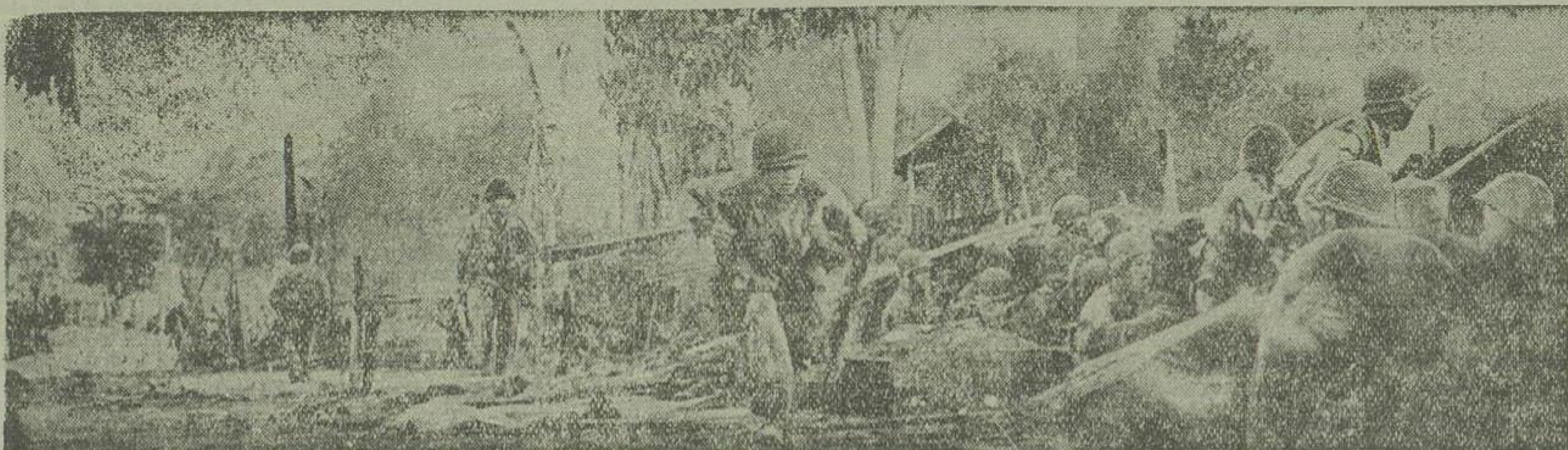
عکس مخصوص مجله لایف که اخیراً برای مشاهده مناطق جنگ هندوچین بیدانهای مختلف تبرده رفته است عکس بالا را از سنگرهای جنوب شرقی دین بین فو برداشته است. در این سنگرها بود که مدت یکصد و هفتاد روز بین نیروهای فرانسه و ویتنام جنگ تن به تن ادامه داشت و سرانجام با تلفات سنگینی که طرفین دادند نیروهای کونیست دیروز موفق شدند مرکز فرماندهی «دین بین فو» را بتصرف در آورند

آخرین پیام دو کاستری این بود: «نیروهای دشمن در چند متری هستند» مقاومت غیرممکن است؛ ما تسلیم نمیشویم»