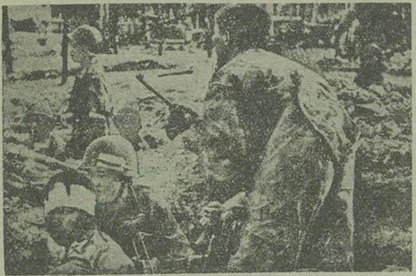
عکس بالاسگرای نیروی مدافع در «دین بین فو» را نشان می دهد. از دیروز بعد از ظهر هیچگونه اطلاعی از این دو در دست نیست

در تمام جبهه های هندوچین با فداکاری قابل تقدیری از مجروحین مواظبت میشود.