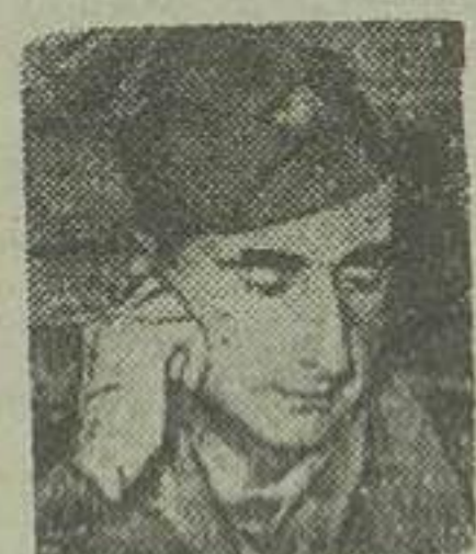
ژنرال دو کاستری فرمانده مدافعین دین بین فو

هانوئی (دوین) پایگاه نیروی فرانسوی در دین بین فو واقع در شمال هندوچین که از چند ماه قبل تحت محاصره نیروی کونیستی ویتنام قرار گرفته بود پس از هشت ساعت نبرد تن به تن بسیار شدید بتصرف نیروی کونیست درآمد. کونیستها حملات خود را در تاریکی شب آغاز کردند و چون در جنوب غربی پایگاه دین بین فو نیروی فرانسوی بقیه در صفحه سوم