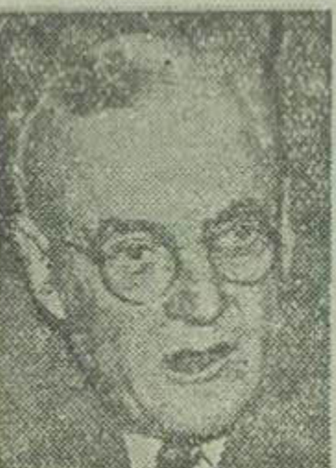
(پس وزیر امور خارجه امریکه) واشنگتن، جان فاستر دالس وزیر امور خارجه امریکه شب گذشته نطقی در برابر رادیو تلویزیون برای مردم امریکه ایراد کرد.