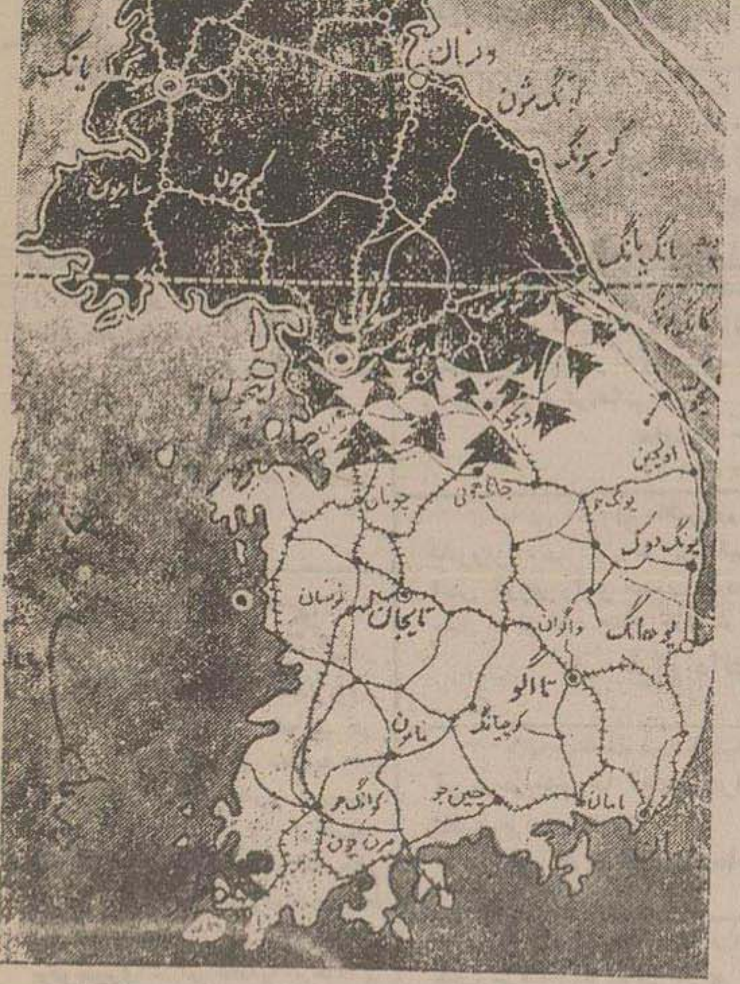
وضع عمومی میدان جنگ کره پس از سقوط شهر سیول

نیروهای مهاجم کمونست پس از تصرف کامل سورل، از پشت سر نیروهای ملل متحد، شهر «ونجو» را تصرف نموده و راه ارتباط امریکائیها را با عقب سر قطع نمودند.