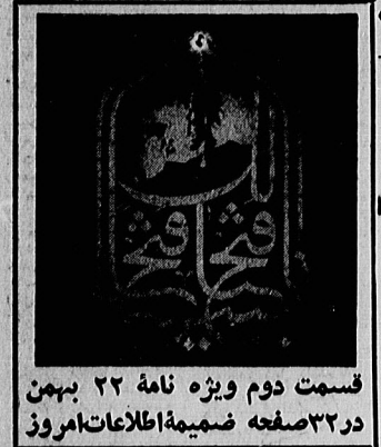
قسمت دوم ویژه نامه ۲۲ بهمن در ۳۲ صفحه ضمیمه اطلاعات امروز