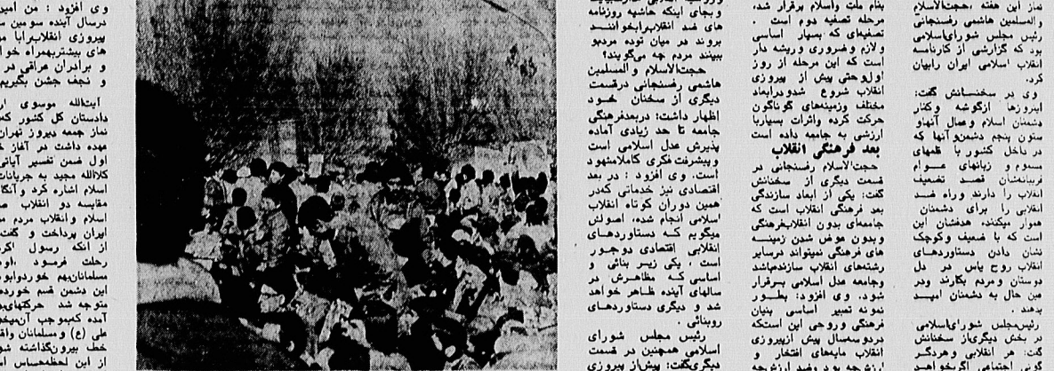
گروه قضایی از پاسداران انقلاب اسلامی در مراسم در روز پیشتازان از دروازه پیشتازها به انظار شهروندان اسلام گشته