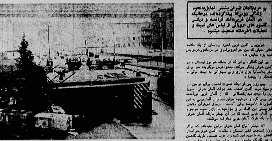
عکسی از مرز معروف میان دو آلمان در برلین، موسوم به «دیوار برلین»

دیوار برلین مانع از عبور و مرور بین شرق و غرب آلمان شده است... (Text continues with news about the Berlin Wall)