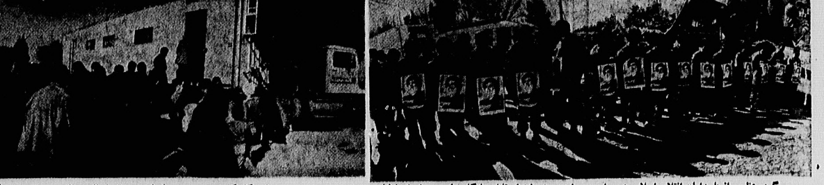
گروه قضایی از پاسداران انقلاب اسلامی در مراسم در روز پیشتازان از دروازه پیشتازها به انظار شهروندان اسلام گشته