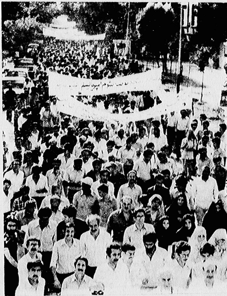
صفوف بهم فشرده اعضا و طرفداران حزب توده ایران به طرف این بابویه پیش میروند...

■ در قطعنامه راهپیمایی به تلاش برضد دشمن مشترک، دریک صف واحد، با همه نیروهای ضد امپریالیست و میهن پرست تاکید شد.