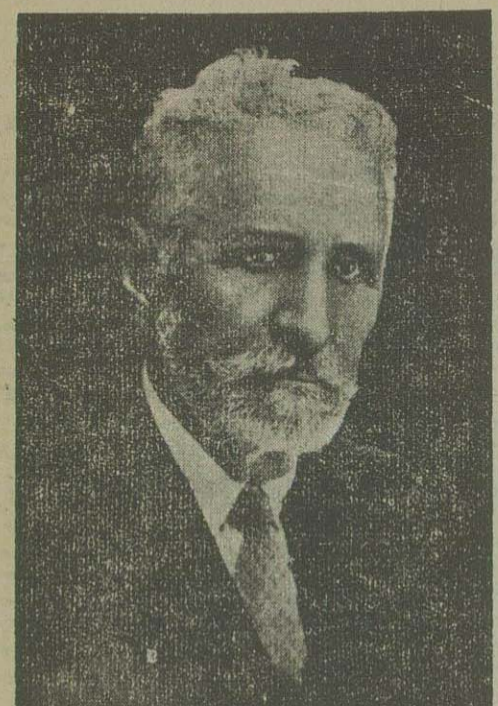
آخرین عکس شیخ خزعل که ده ماه قبل از فوت او بر داشته شده

۱- خطاب دادگاه به آقای معنی نماینده دادسرا در آخر کيفرخواست مورخ ۲۸/۲۸/۴۲ راجع باتهام قتل مرحوم سید حسن مدرس در موقه استناد بیوادم جزائی (جزء ماده ۲۷ همان قانون) و جزء مقصود تمین نکردید متقاضی است صریحاً معین نماید که مقصود از عبارات نگاشته شده متن اول ماده ۲۷ قانون مجازات عمومی بوده یا شق دوم آن یا شق آقای معنی - مقصود از عبارت ( و جزء ۲۷ همان قانون ) شق