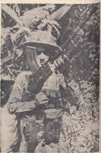
یک چریک‌دوئی پاکستانی که با سلاح توپامیک خود در جنگهای منطقه «چنور» شرکت دارد.

★ در بمباران داکا، قسمتی از شهر آتش گرفت و گروهی از مردم سوختند