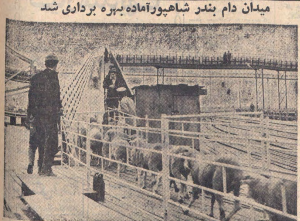
میدان دام بندر شاهپور آماده بهره برداری شد

سازمان گوشت کشور بهره برداری از بل هوایی میدان دام بندر شاهپور جهت انتقال (گوسفندان زنده استرالیایی از کشتی به میدان دام) آغاز نمود میدان دام بندر شاهپور که مساحتی در حدود بیست هزار متر مربع را دربر گرفته برای طرح سازمان گوشت کشور و با نظارت وزارت تولیدات کشاورزی و مواد مصرفی ساخته شده و محوطه سر پوشیده میدان گنجایش حدود پانزده هزار رأس گوسفند را داراست و گوسفندان زنده را از گرمای شدید تابستان جنوب مسون نگاه میدارد . آب و هوای این میدان همیشه از علوفه مناسب مملو می باشد . می تواند از تعداد گوسفند فوق پمدت بیست روز پذیرایی نماید و وجود این میدان و انبار و سایر تاسیسات عرضه گوشت را به نقاط مختلف کشور در حد متعادل تکمیل میدارد . بنابراین نماینده سازمان گوشت در بندر شاهپور چنانچه تقاضای کوچکی که جنین عمل و نگهداری دام پیشخورده بظرف گردان میدان می تواند حداقل گوشت سه روز شسر طهران را به تنهایی ذخیره کند و علاوه بر تامین گوشت طهران بشهرستانهای اصفهان و شیراز و مشهد نیز در واقع از زوم گوسفند فرستاده می شود . عکس بالابال هوایی میدان دام بندر شاهپور را پس از افتتاح هنگام حمل تعدادی دام از اسکله ۳ به میدان نشان میدهد . چند تن از مأمورین سازمان گوشت کشور نیز در عکس دیده میشوند .