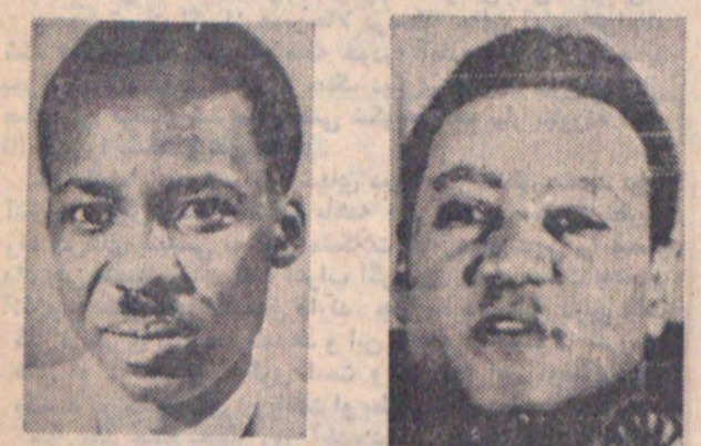
ژنرال جعفر تومیری رهبر سودان، جلیوس نایره رهبر تانزانیا نخست روز اول از کودتای اوگاندا اظهار کودتای اوگاندارا تحمل نمی کنم نگرانی کرد.

نحوه مصرف شهریه دبیرستانهای دولتی تعیین شد در صفحه ۴