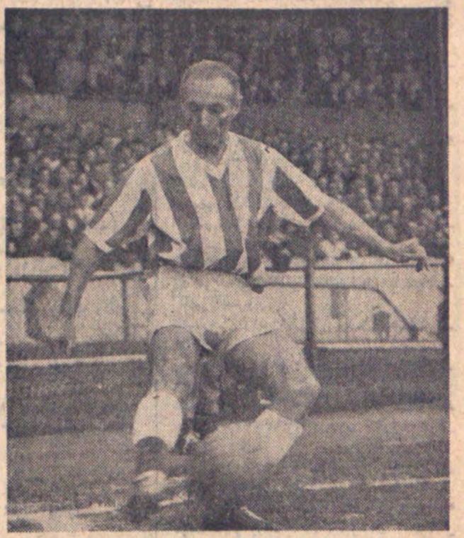
ماتیوز طی اقامت خود در ایران همراه با تیمهای کارگر آبادان در آبادان و باتیم تاج در تهران دو مسابقه خواهد داد

بعد از ظهر یکشنبه هفته آینده مصادف با دیدار میان سر استانی ماتیوز با بازیکن مشهور سابق تیم ملی فوتبال انگلستان در پست گوش راست تیم فوتبال باشگاه تاج تهران در یک مسابقه فوتبال در استادیم امدیه شرکت خواهد کرد . تیم مقابل تاج هنوز برگزیده نشده است . لیکن به احتمال بسیار یک تیم منتخب قدیمی فوتبال ایران حرفه استانی ماتیوز و تیم تاج در این دیدار دوستانه خواهد بود . سر استانی ماتیوز که در پیست ساله اخیر یکی از بهترین گوش راستی های جوان بوده و تا مرز