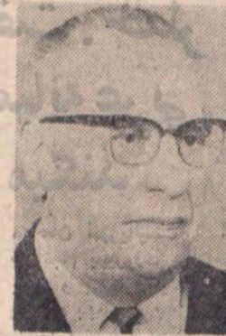
حضرت جودت سونای رئیس جمهوری ترکیه

به جهانگردانی که وارد ایران در صفحات میشوند هدایائی داده میشود ۷۰۴