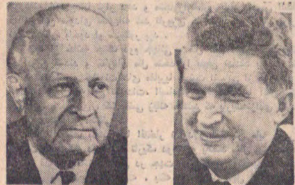
حضرت نیکلای بادکورتی رئیس جمهوری رومانی رئیس جمهوری چکسلواکی حضرت ژنرال اسوبودا

روسای کشورهای که برای شرکت در جشن با ایران می‌آیند