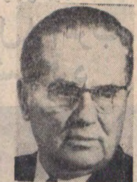
حضرت مارشال یوزیپ بروزنیو رئیس جمهوری یوگسلاوی