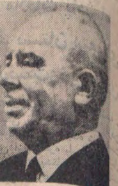
حضرت نیکلای بادکورتی رئیس جمهوری رومانی