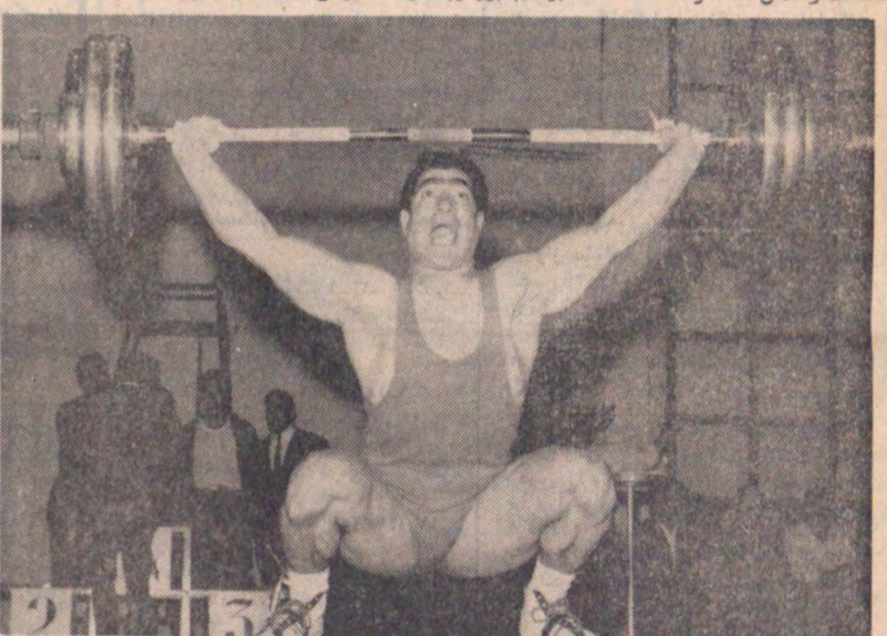
یوردژم با ۴۲۵ کیلو گرم در تیم سنگین قهرمان آسیا شد.