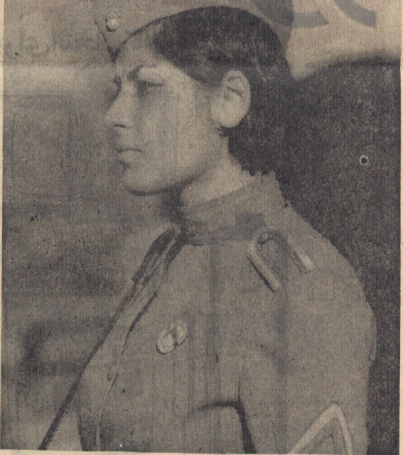
زنان آزاد ... دختران ازبند رسته درام سازندگی ایران نوبین همایه مراد تلاش می کنند .

پرچم داربهر وزی در آسپاشده است . این واقعه در تاریخ ایران به عنوان یکی از مهم ترین وقایع شناخته می شود . این واقعه در پی تحولات اجتماعی و سیاسی کشور در آن زمان رخ داد .