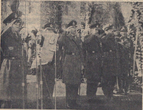
امروز نیروهای مسلح شاهنشاهی بیکره اعلیحضرت رضا شاه کبیر را گلباران کرد.

کارکنان سازمان تربیت بدنی، طی مراسمی باشکوه خجسته سالروز اعلیحضرت رضاشاه کبیر را گرامی داشتند