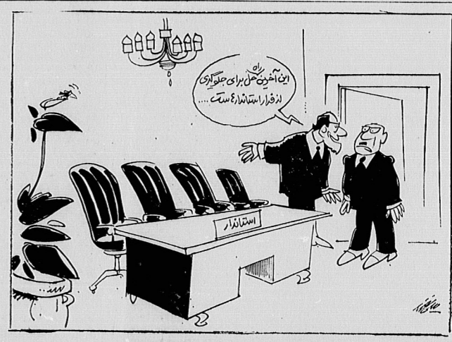
چهارده فروردین از این در نیمه شهریور تا پایان خرداد

محمد ابن مکر میگرد: این نسبت که با فواید زندگی برابر باشد بیشتر برای زندگی مردم و با کمتری آرزو شده است. باید متوجه بود که مردم و با کمتری آرزو شده است. باید متوجه بود که مردم و با کمتری آرزو شده است.