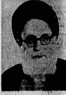
آیت الله العظمی گلپایگانی

آیت الله العظمی گلپایگانی: قانون اساسی اسلام قرآن و سنت است در صفحه ۱۱