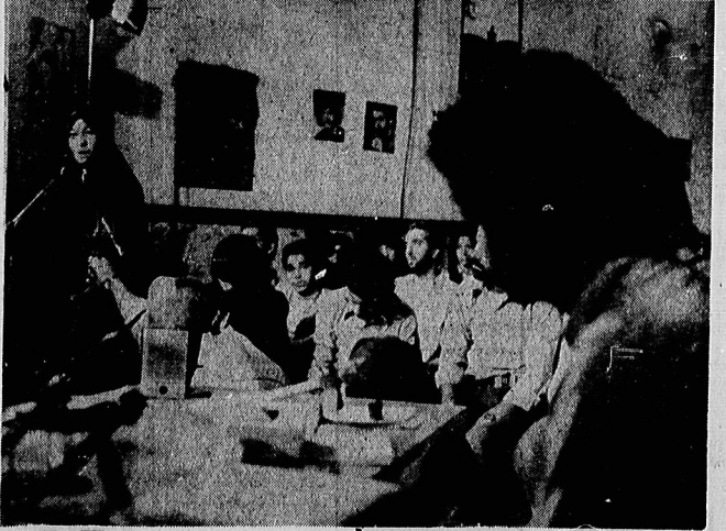
یک زن مجاهد که بوسیله آتش شکنجه شده بود، در دادگاه انقلابی علیه آتش شکنجهت دادو تقاضای مجازات او را در صفحه ۹ کرد.

امروز روز تعارف نیست روز تدوین سند انقلاب است در صفحه ۱۷