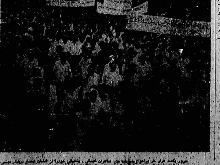
امروز یکصد هزار نفر در راهروین میدان تختی تظاهرات خیابانی و تحصیلی خود را از افشای جنایت ارتش و پاسداران خرمشهر آغاز کردند. عکس صحنه ای از این تظاهرات را نشان میدهد.

ایا یک مقام امارات عربی متحدت گفت که هنوز آیت الله خلیفانی در محموله تاسیس آن دفتر سفارتی با آنها گفته است. او گفت تاسیس آن دفتر مستقیم تصویب شورای عالی حاکمان امارات است. اما هر حال ما از انقلاب اسلامی هم سفارت هستیم. با روزنامه اطلاعات اعلام شد که آیت الله خلیفانی و یهودی در رژیم اسلام ایران از یوزاندهای اسرائیل در خصوص تکلیف بر خورده اند. هرگاه بران که منگنر