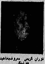
توران گرمی مروفه با نهادی هوشنگی