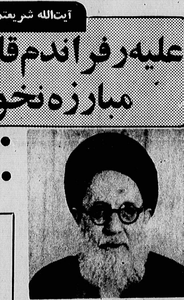
آیت الله شریعتی

ضوابط جدید روابط کار در کارگاههای سراسر کشور