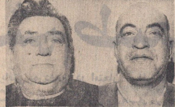
برندگان جایزه ۳۰۰ هزار تومانی دومین سری بلیطهای اعانه ملی مخصوص نوروز

دومین سری بلیط های اعانه ملی مخصوص نوروز بدست آورده اند، مصاحبه‌های روزنامه بنظر خوانندگان ارجمند بعل آمده است که در همین خواهد شد