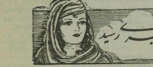
زنی که بیگانه رسید

با خرید یک بخت آلمانی بیگانه حمایت صادران کمک کنید.