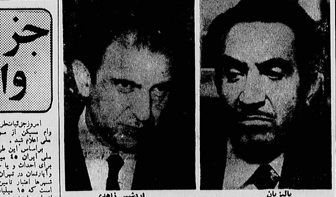
پالیزبان اردشیر زاهدی

زاهدی و پالیزبان با ۲ میلیارد دلار اعتبار، مأمور توطنه علیه انقلاب ایران شده اند مأموران ویژه ایران در پایگاه پالیزبان نفوذ کرده اند یک مرد بلندقد مرزومه جاهلراه زاهدی دیده می شود