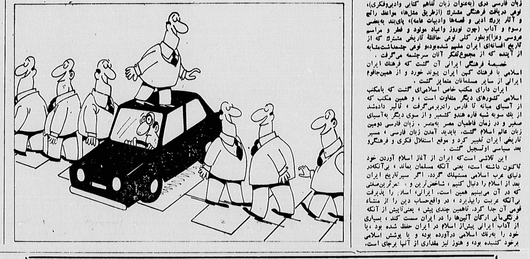
این تلاشی است که ایران از آغاز اسلام آوردن...