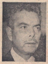
سفیر اردن : اخطار ایران ، ادامه سیاست دوستانه تهران نسبت به برادران عرب است