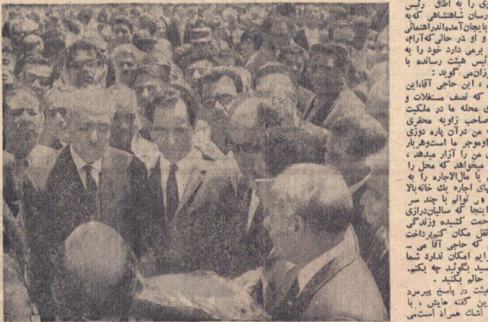
بازرسان شاهنشاهی بهر کجا که می‌روند مورد استقبال گرمی می‌باشند.

بهره‌رانه دود گوز کرده و رنج دیده با چشمانی که دور انگشتانی لرزان دهنشی لنگر می‌چرخد و از وارد شدن استخوان درمی که در مرکز شهر قرار دارد می‌شود و خاکش به درین می‌گردد. می‌خواستند که آقا با این بازرسی‌ها عجلت داشتند که می‌توانستند در آنجا بمانند و بازرسی‌ها را به سرانجام رسانند. اما در آنجا نماندند و به طرف تهران راهی شدند. در آنجا بازرسی‌ها را به سرانجام رساندند و به طرف تهران راهی شدند.