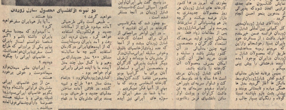
این نمایش در روز شنبه ۱۳۴۹ برگزار شد و به استقبال بسیاری از مشتریان افتاد.

نمایش کیف و کفش شارل ژوردان در هتل هیلتون. این نمایش در روز شنبه ۱۳۴۹ برگزار شد و به استقبال بسیاری از مشتریان افتاد. کیف‌ها و کفش‌ها در این نمایش به نمایش گذاشته شدند.