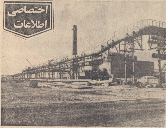
مسیر لوله های حوائی آب و گاز از کوره بلند به نیروگاه ذوب آهن آریامهر.

لازم به یادآوری است که چون تاکنون میزان تولید مواد نوساز داخلی بسیار ناچیز بوده است لذا نیاز به واردات مواد نوساز برای کوره های کوچک از خارج وارد میشد. برپایه دوره ساختن مرحله اول کارخانه ذوب آهن آریامهر نیز این مواد از خارج وارد می شود. در این زمینه همسران ملی می توانند به کمک کارخانه ذوب آهن آریامهر در تولید مواد نوساز داخلی کمک کنند. این کارخانه با تولید مواد نوساز داخلی می تواند به کشور کمک کند.