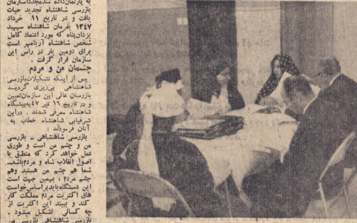
زنی سخن می‌گوید و رئیس هیئت با دقت به حرفهای او گوش می‌کند.

بازرسان شاهنشاهی در هر وقت که به کار می‌روند به دقت و توجه و مسئولیت و دلسوزی شعار می‌دهند. این بازرسان در هر وقت که به کار می‌روند به دقت و توجه و مسئولیت و دلسوزی شعار می‌دهند. این بازرسان در هر وقت که به کار می‌روند به دقت و توجه و مسئولیت و دلسوزی شعار می‌دهند.