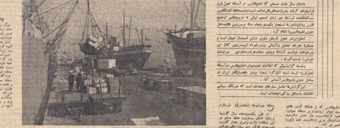
واینبار آفتاب استعمار در خلیج فارس. این پروژه بزرگ در حال انجام است و به زودی به پایان خواهد رسید.

واینبار آفتاب استعمار در خلیج فارس. این پروژه بزرگ در حال انجام است و به زودی به پایان خواهد رسید. این پروژه شامل احداث بندر و سایر تاسیسات است.