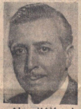
سفیر افغانستان : شاهنشاه ایران دهرجراحی که منافع اعراب درخطر بوده به دفاع برخاسته است از محمد پورداد در صفحه ۲۹