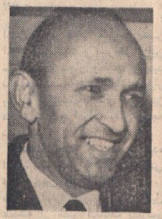
سفیر جمهوری متحده عرب : نظریات دولت ایران باعث دلگرمی مصر شده است