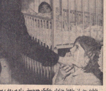
شهبانو در دیداری از معلولین

یک موتور لنج در خلیج فارس با ۱۰ سر نشین ناپدید شد در صفحه ۴