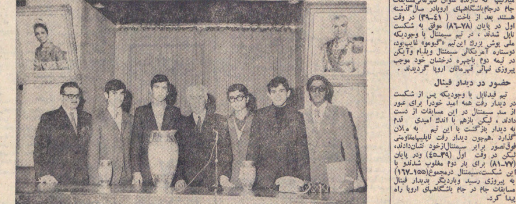
حضور دو دبیران فینال تیم فوتبال با وجودیکه هر دو از شکست در دیدار رفت هفت امتیاز خود را برای عبور از سد سیمنتال در این مسابقات از دست داده، لیکن بازی با اندک امید قدم در دیدار برگشت با این تیم به برابری رسید. در دیدار رفت تیم اسپانیایی با تیم سیمنتال میلان با نتیجه ۳۴-۴۳ پیروز شد. در دیدار برگشت تیم اسپانیایی با نتیجه ۴۳-۳۴ پیروز شد.