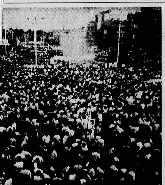
سنگوی دولت امروز اعلام کرد براساس آمارهای رسمی بیش از ۱۱ میلیون نفر در شهرهای بزرگ کشور نیروی در راهپیمائی وحدت شرکت کردند. در صفحه ۲

ابر قدر تهادر خلیج فارس تا کتیک عوض میکنند