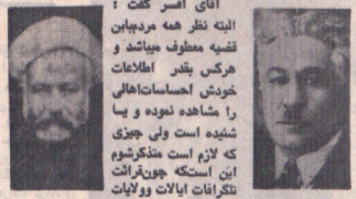
آقای اسمر گت ، البته نظر همه مردمیان قنیه صرف میباشند و فرسک بشر اطلاعات غرضی احساسات اهالی شوره شده بود و با شاهده نوبه و پس شته است ولی جنجی این اسکله جویرات است که لایق مکتزگوشه و باین تلگرافات احساسات نظر بینتری معلوف بدارده ممتد که افلا اسم ولرات وایلات برده شود. (نماینگان گفتند صمغ است.)

پس از سیست یافتن جنس آتای رومیس اظهار داشت اگر تریاک نشسته گانگنه خورام بد به که نوس مکتبا علی زانتر بود حتی در زمان نادر شاه بودان امروز جیست داشته که اگر آن جیست پای بود امیر مملکت ما جایی پتار و مصلحت روی جازیز میرفت ، یکی از اقدامات نادر برای ازبایدن طوس لفظ صحت اهلی مکتب و پیوسته برای ارفی میباشند. گنوا ارفان آینه در طهران شیوع یافته و با ابتک صمغ عقیق و آبله کوب مجانی در سترین میوهگاشته است که مردم استقبال نمیکند حتی در همین ماه پیش از حد ملی دوستیست که نگر از افغان از آبله تلغ قاشقا کم میخواستن از وزارت داخله قاشقا کم کبابه آبله کوبی اجباری را بهمین کلامه بردن چون مردم نگرهتانه که قبل از گذشتن برای آبله افغان خود را میخواستند ضمن جویگری بیجا میماند شیوع یافته و با ابتک صمغ عقیق و آبله کوب مجانی در سترین میوهگاشته است که مردم استقبال نمیکند حتی در همین ماه پیش از حد ملی دوستیست که نگر از افغان از آبله تلغ قاشقا کم میخواستن از وزارت داخله قاشقا کم کبابه آبله کوبی اجباری را بهمین کلامه بردن چون مردم نگرهتانه که قبل از گذشتن برای آبله افغان خود را میخواستند ضمن جویگری بیجا میماند