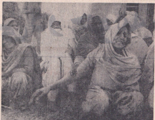
انزرویسی خارج‌وزیر نامه اطلاعات

فرانکوئیزین هتج جنگ در کردنه که خیر داکا بمناقصه نیرو های هندی برآمده است ولی بدون کوشش نظامی ایلام نشاندهنده در همه جهه ها به پیکار ادامه خواهند داد.