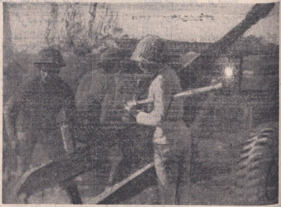
در حالی که در جبهه پاکستان شرقی نیروهای هندی پیشروی می کنند در جبهه غرب قوای پاکستان شکست های سختی را متحمل شده و هند وارد کرده است. در عکس که از یک نقطه مرزی بین هند و پاکستان غربی گرفته شده سربازان هندی هنگام دفاع از مواضع خود که مورد حمله پاکستانی ها قرار گرفته دیده می شوند. عکس را بدینوسیله اطلاعات

۵۰ هزار سرباز پاکستانی از داکا دفاع می کنند دولت پاکستان اعلام کرد: وضع فوق العاده وخیم است هزاران چتر باز هندی در اطراف داکا پیاده شدند