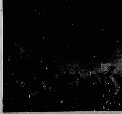
آغاز درگیری - دهها دست بلند است. بعضی هاست گره گره را بطوان اعتراض بلند کرده‌اند. راهپیمائی بهمین دست‌هاک باید امروز در پیگیری حلقه شود. بسوی هبوط خود، سنگ و چوب و آهن پرتاب می‌کنند

بمیان مخالفان مطبق آیدگان بمیرخوردی خوشین نجامید و حدود ۶۰۰ نفر در این ماجرا، جراحی برداشتن. خبرگاران ما که از عصر دیروز در محل حاضر بودند گزارش داده اند: تظاهرات از ساعت ۸ نمادظهر و از محوطه دانشگاه آغاز شد. هزاران نفر از مردمی که در دانشگاه جمع شده بودند، در صوف منظم شروع به دادن شعار هایی علیه روزنامه آیدگان و تأیید حکم دادستان انقلاب. مینی بر تعطیل و توقیف آیدگان کردند. در این میان آنها که به دعوت جبهه دموکراتیک ملی به دانشگاه آمده بودند، در زمین چمن دانشگاه گردهم آمده بودند و در سکوت کامل اجتماع کرده بودند و بین خود اعلامیهای سازمان چریک های فدائی خلق و جبهه دموکراتیک و چند سازمان سیاسی دیگر را بخش می کردند. ساعت ۶ بعد از ظهر، نظری میسرید که ماجرای راهپیمائی امروز به همین ترتیب و با آرامش پایان یابد، ولی ناگهان از سمت غربی خارج از دانشگاه (خیابان آتاترک فرانس) پلاکاردها و شعارهایی بر پرده نوشته شده‌ای که بر روی آیدگان نیز، آمریکا و توقیف آیدگان محکوم شده بود، دردمت کمتر از ۳ دقیقه بر روی ستهای پیش از ۳ هزار نفر خنثی سپس برپا شد. بدین ترتیب جبهه دموکراتیک ملی، راهپیمائی خود را که به نظر می‌رسید به هیچوجه تشکیل نخواهد شد آغاز کرد. آغاز درگیری گروه‌های مذهبی و فرارگران حکم دادستان انقلاب که در شمارهای مختلف خودخوانده تشکیل بغی در صفحه ۲