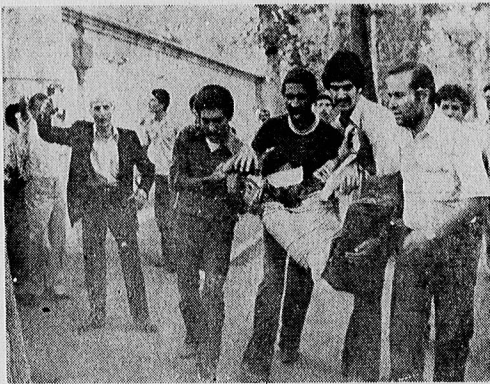
امید که این حوادث دیگر تکرار نشود. شرحی بر این عکس نمی‌توان نوشت چرا که صحنه و جریدها، خود سخن می‌گویند.