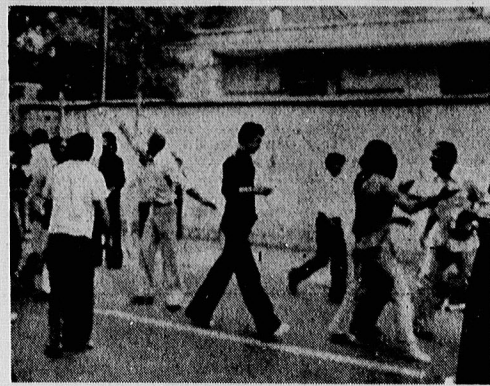
دعوت به فرار - ماندن، همان و خونین شدن سز و صورت هانا؛ فرار بهترین کار است