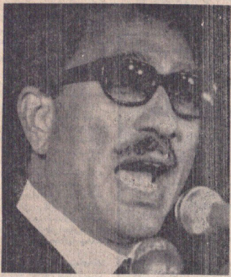
سادات خطاب به سران مصری گفت مشیت الهی حکم میکند که شما بگوییم که ما با قاطع ما چنگ است

بر اساس آییننامه ای که به هیات دولت فرستاده شد یک هواپیما با ۳ نفر مسافر ایرانی منفجر شد در صفحه ۴ پرداخت مزایای غیر مستمر کارمندان تغییر میکند * برای حق تالیف، حق و ساعتی تواما ممنوع شد * میزان حق تدریس در دانشگاههای و آموزشها تابع وزارت آموزش و پرورش تعیین شد * در صفحه ۴