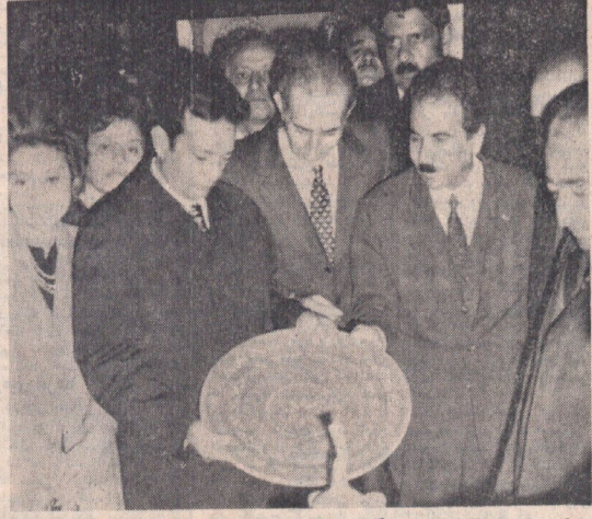
عکس: فرماندار کل همدان، هنگام بازدید از صنایع دستی غرقه همدان نشان میدهد. جمعی از مدعوین نیز حضور دارند.