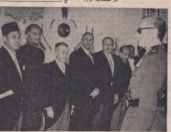
مغرب اول از سمت چپ - در مراسم سلام عید فطر درروز محمد مهدی عبدالخلیل سفیر مغرب هاپونی تیریک میگوید. بعد از سفر مغرب به ترتیب سردار شهناز خان سفیر پاکستان، وزیر المعارفین تیریک سفیر اندونزی، محمد عطا الرحمن سفیر هند، نامیک یوگا سفیر ترکیه، محمد سیخ اور سفیر جمهوری عربی مصر، خلیل اخلیل سیریلینانو ظهیر مراتت کاردار سفارت سوریه در عکس دیده میشوند.

ایران صد میلیون ریال پنبه به چین فروخت این معامله بوسیله اعضای هیئت بازرگانی ایران که در قتل و بعد از برقراری روابط سیاسی با این کشور به چین رفتند صورت گرفته است. اکثر صورت هیئت بازرگانی ایران کسب ریاست آقای عبدالملک فرمانرمانان برای شناسایی بازار چین بود. ایران به صادرات پنبه به چین وارد تهران شدند. سفر اکتشافی آقای فرمانرمانان رئیس