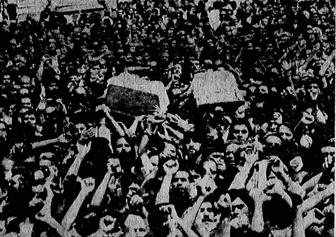
۵۰۰ هزار نفر در قم جنازه عراقی های شهید را تشییع کردند