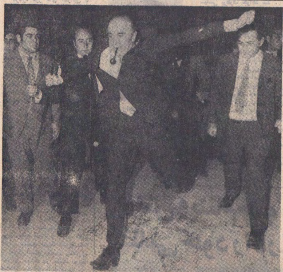
شوق جوانان هنگام بریدن از روی شعله های آتش و گفتن «ژدی من ارتو» سرخی تو از من ، آقای هویدا نخست وزیر را هم در کاخ جوانان سر شوق آورد و بطوریکه در عکس دیده میشود نخست وزیر با عصا و بیب و دمک بسته کت ، از روی شعله های آتش بپوته میدرد!