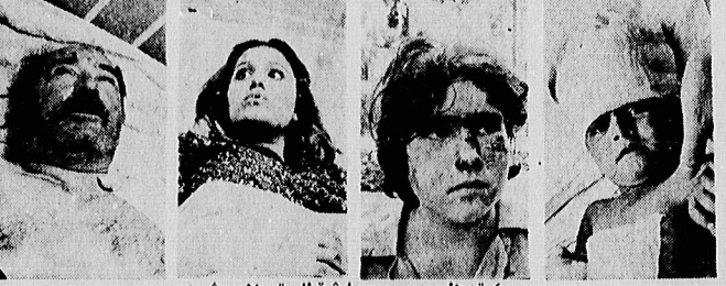
۴ تن از مجروحین حادثه قطار تهران - مشهد