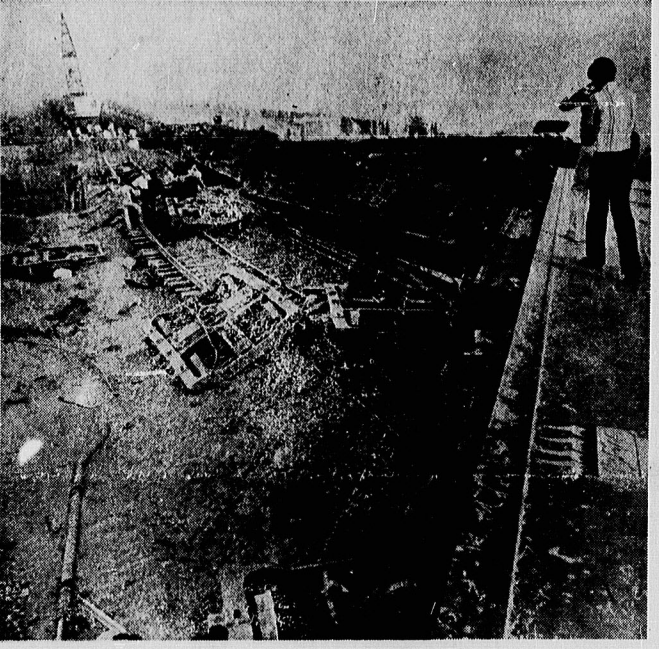
حادثه قطار تهران - مشهد یکی از شدیدترین سوانح راه‌آهن در ایران بود. این عکس نشان‌دهنده این واقعت است

طبق آخرین آمار، کشته‌شدگان ۱۰ نفر و مجروحین ۷۰ نفر هستند