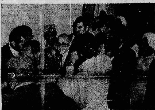
مهندس بازرگان نخست وزیر، یزدانی از دانشگاههای اتمی بازدید کرد. هنگام این دیدار، قضات، کارکنان دانشگاهها و زندان قصر و تاشاچیان یکی از دانشگاهها نیز با نخست وزیر گفتگو کردند. عکس از این دیدار برداشته شده است. صفحه ۲

خلع سلاح عمومی در خرمشهر آغاز شد * فرماندار: به طریق دو دست مردم اسلحه است در صفحه ۲