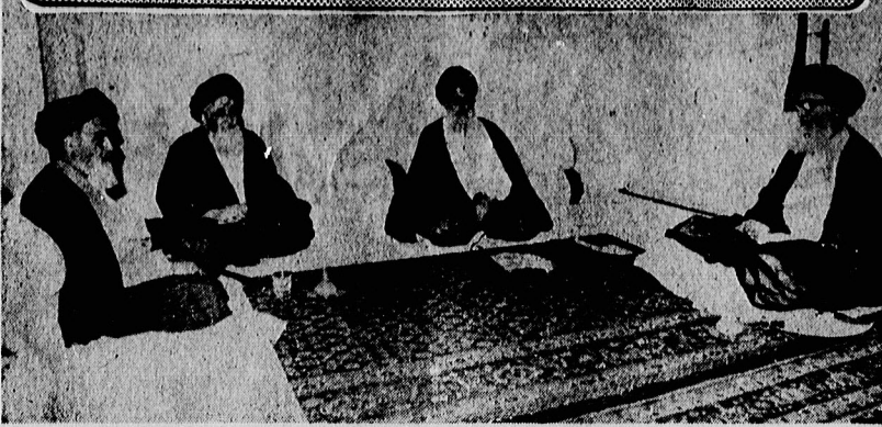
برای نخستین بار، صیال موم و ملکن با حضور چهار رهبر مذهبی، در منزل حضرت آیت الله العظمی گلپایگانی به طرح کشنده شد. ریش و امروز، میلوها مردم ایران، درانتظار دریافت خبر موفق از این جلسه بودند اما تقریباً هیچ خبر رسمی در این زمینه بدست نیاوردند. در این عکس تاریخی و کم نظیر، به ترتیب از چپ امام خمینی و آیات عظام مرعشی نجفی، شریعتداری و گلپایگانی دیده می شوند.