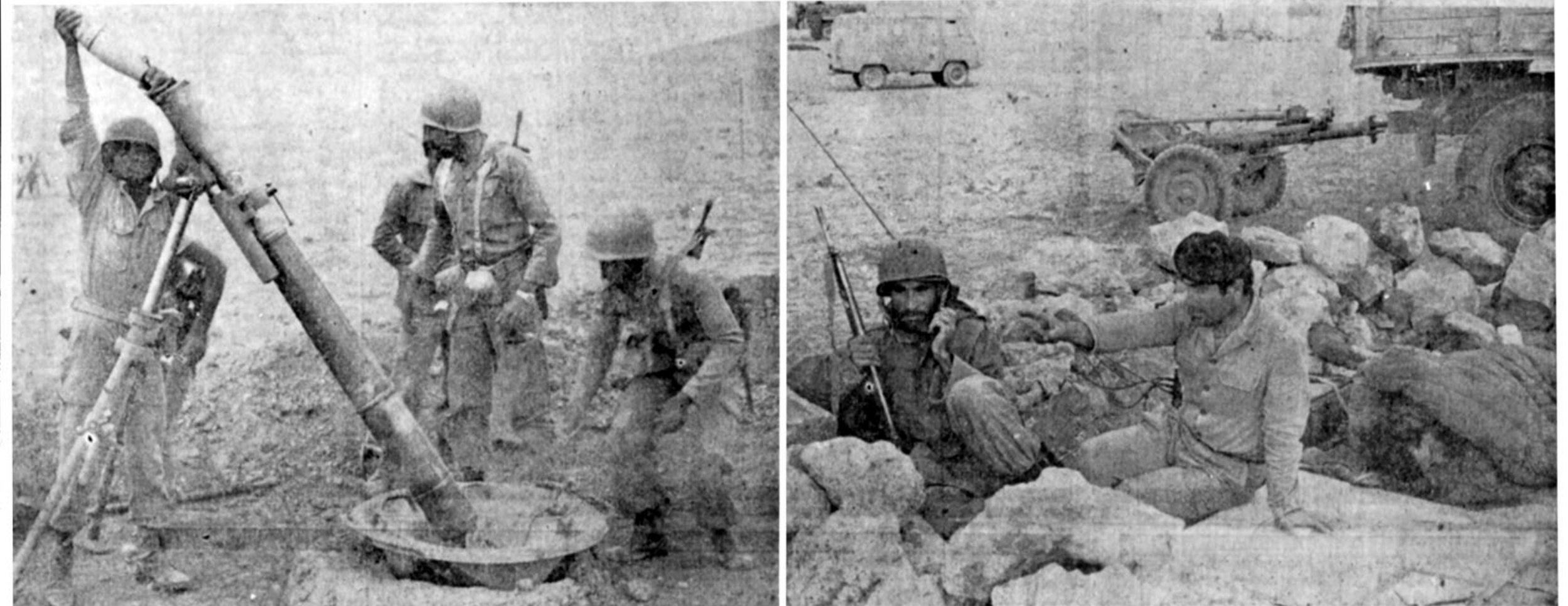
نیروهای نظامی، در نقاط مختلف کردستان، پس از شناسایی مواضع مخالفان، ضمن تماس با ستاد عملیاتی ارتش که معمولاً با بسیج انجام میگردد، حمله خود را آغاز میکنند. اینجا، یکی از مراکز مخابراتی در غرب کشور است و یک افسر پس از کسب دستور از ستاد عملیاتی، چگونگی حمله را تشریح میکند. کسی که نسبتاً صبح در این سنگر پیکار مانده بود، حالا برای تجدید قوا، در کیسه خواب، به خواب رفته است.

ارتش برای استقرار در سردشت، تاملر پیشروی میکند