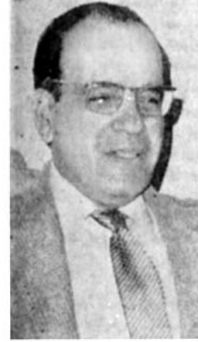
دکتر مگری در صفحه ۲

۱۷ شهریور تعطیل اعلام شد در سندج و خرم آباد ۲ مردو یک زن اعدام شدند