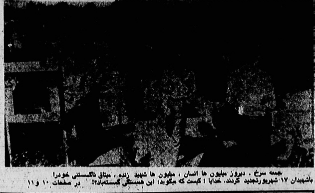
جمعه سرخ - دیروز میلیون ها انسان، میلیون ها شهباز زنده، میثاق لاکستی خوردند