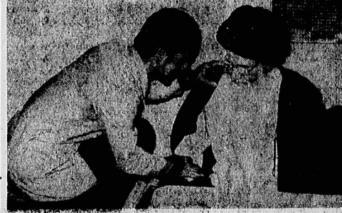
دیدار نخستوزیر با آیات عظام گلپایگانی، مرعشی نجفی و منتظری