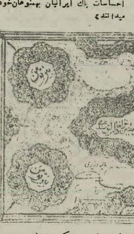
این اسکناسی است که دمو کراتها از طرف حکومت ملی آذربایجان در آستارا منتشر کرده، بزور بردم میدانند و پول و اسکناس های ایران را از آن ها میکرفته