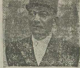
دمو کراتها خاتمه یوسف را غارت کرده خود او را نیز اسیر کرده از آستارا بیرون کشیدند

فرستاد. انجمن برای قبول اهانه و هرچه له اهالی تهران جواتند با آستارا بدو، هر روز پلوت است. هر روز و شب این اقامه انجمن روزنامه نگاران محل فعالیت نهی می شده کثیری از روزنامه نگاران است. مردم دست دست برای کمک می آید.