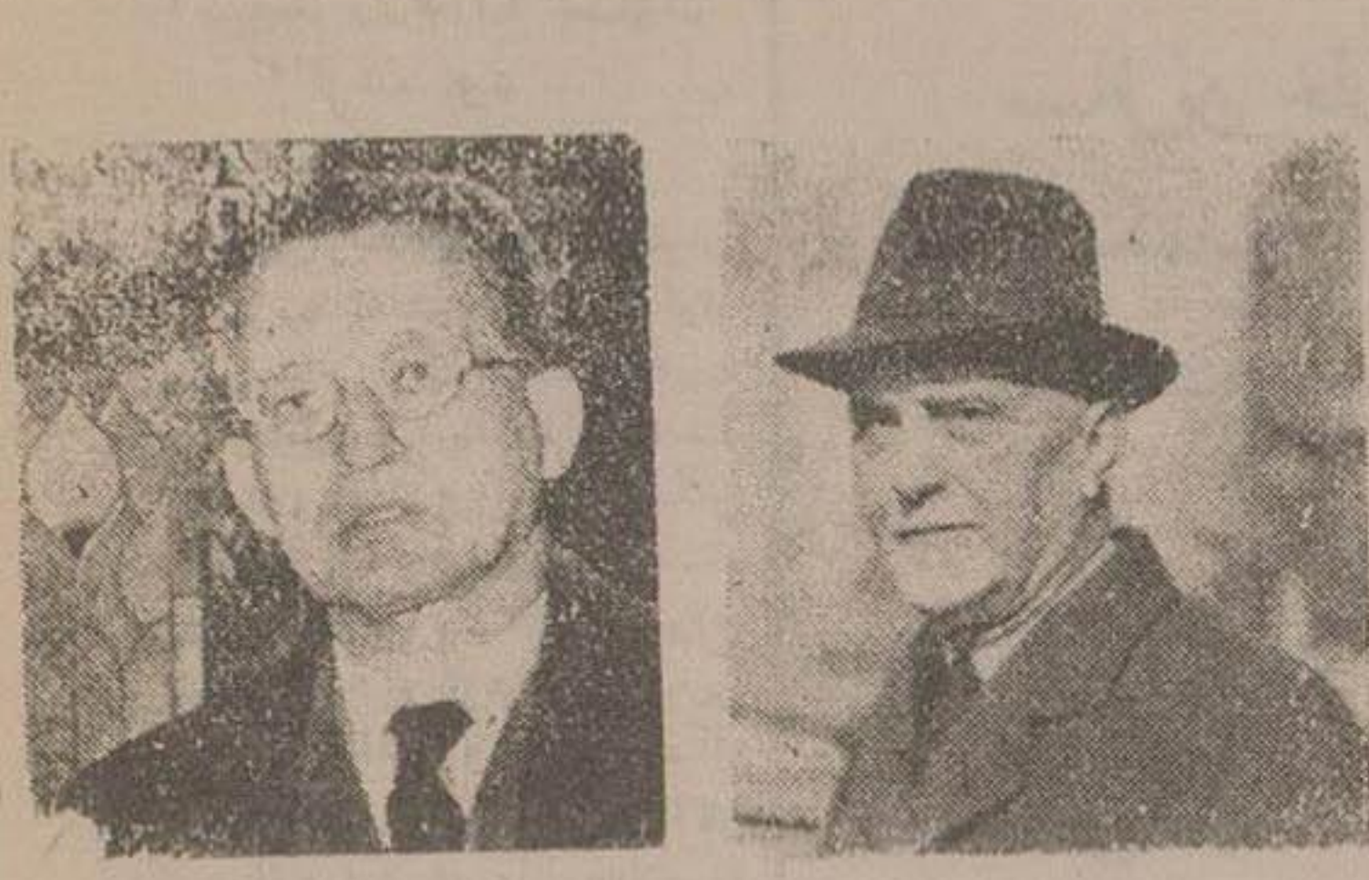
دو کاسپری نخست وزیر ایتالیا کنت اسفوزا وزیر خارجه ایتالیا