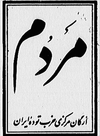
ارگان مرکزی حزب توده ایران

آئین نامه ای موافق با روح انقلاب و نیاز تکامل دموکراتیک جامعه ضرور است