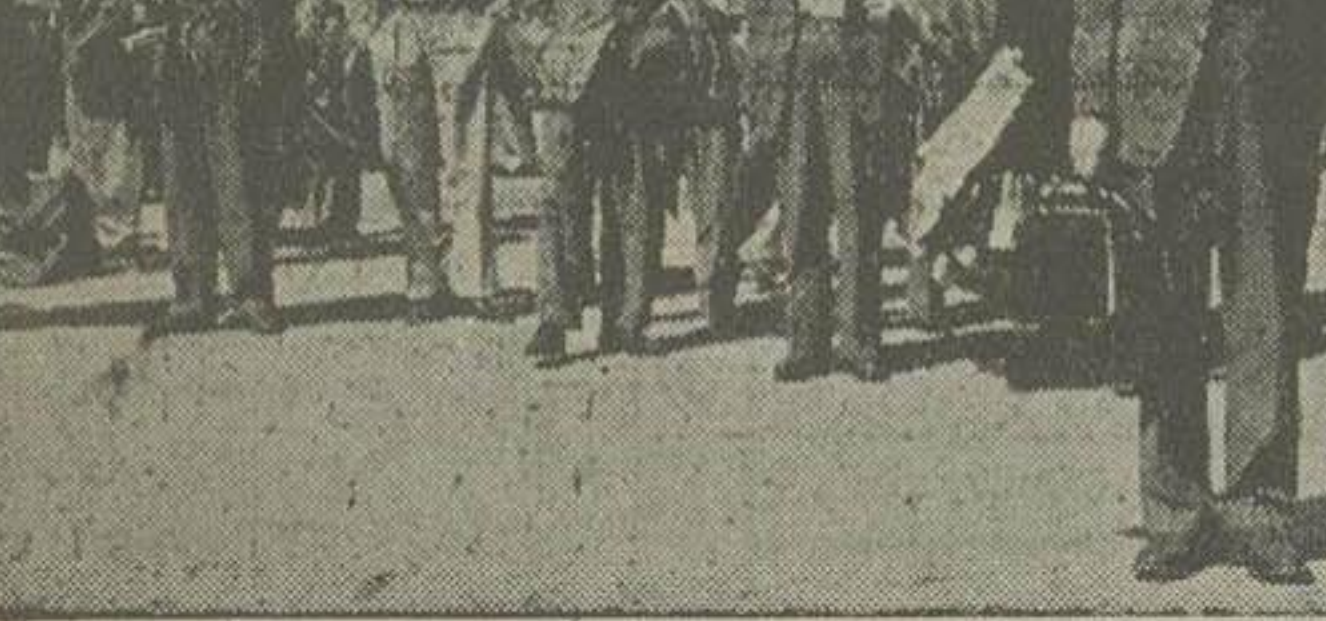
در عکس بالا چند تن از کارشناسان کنسرسیوم بین المللی نفت که روز گذشته با هواپیما از قاهره بآبادان وارد شده اند دیده میشوند

بخیر نگار ما اظهار داشتند: ایرانیان بخوشی قادرند که دستگاه را اداره کنند و تاکنون بنحوشایسته از پالایشگاه نگهداری کرده اند