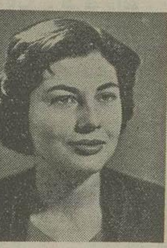
ملکه تریا یازدهمین سال تولد گاندی

در مورد «هزستی مسالنه آمیز» ویشینگی گفت این یک مانور تبلیغاتی شوروی نیست بلکه یک اصل کلی است که تمام مداران شوروی از آن پشتیبانی میکنند.