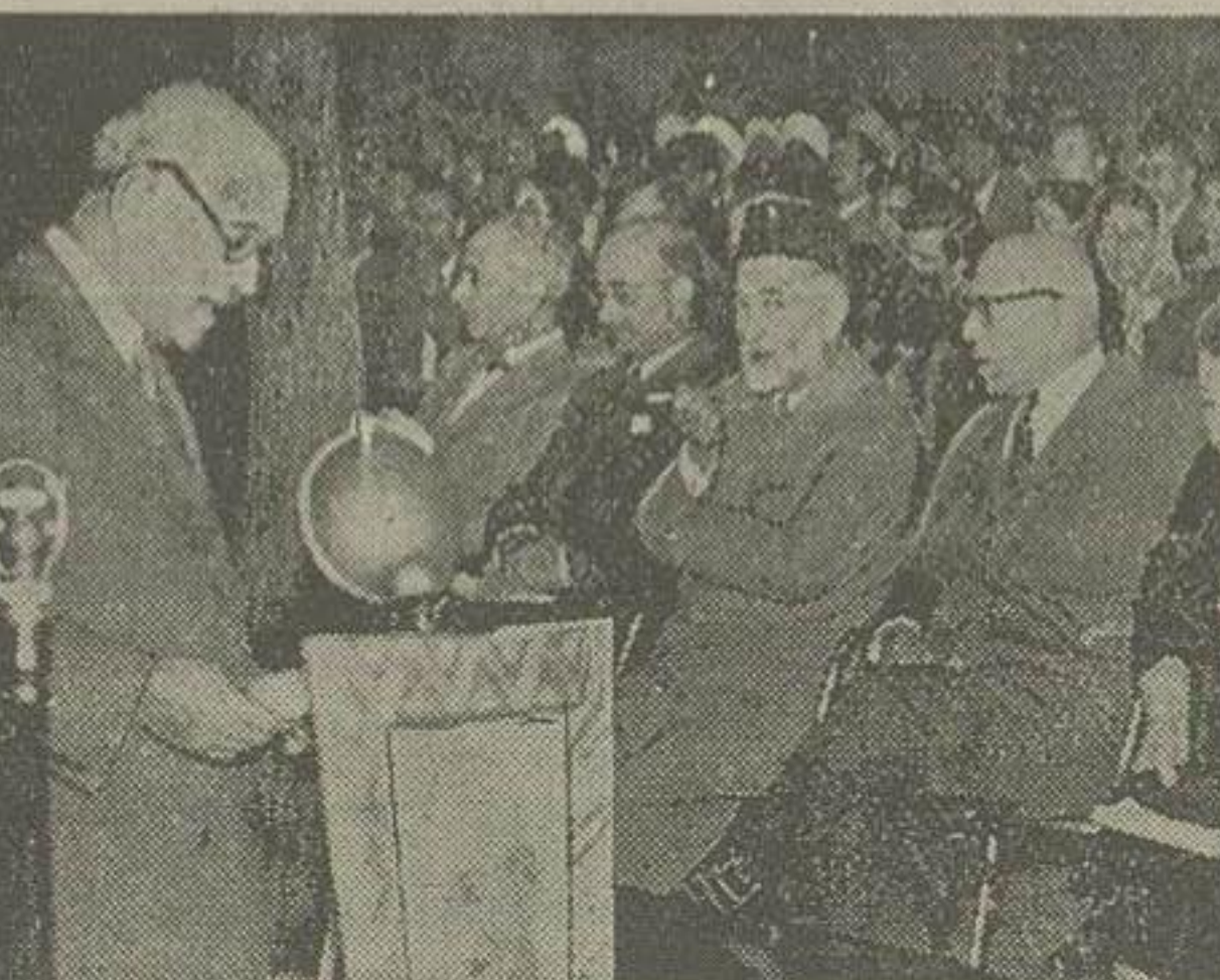
در عکس بالا آقای دکتر تارا چند سفیر کیرهندوستان هنگام ایراد نطق در برابر مدعوین دیده میشوند

شش سال پیش، روزی ۱۹۴۸ یکی از بزرگترین مردان متفکر دنیای معاصر و رهبر آزادی طلبان هند بدست یک هنرمند ماجراجو قتل رسیده با مرک گاندی، نه تنها ملت دوست و همجواریمانند، بلکه کلبه کتورهای آزادی خواه و صلح طلب جهان قریب نامش شدند.