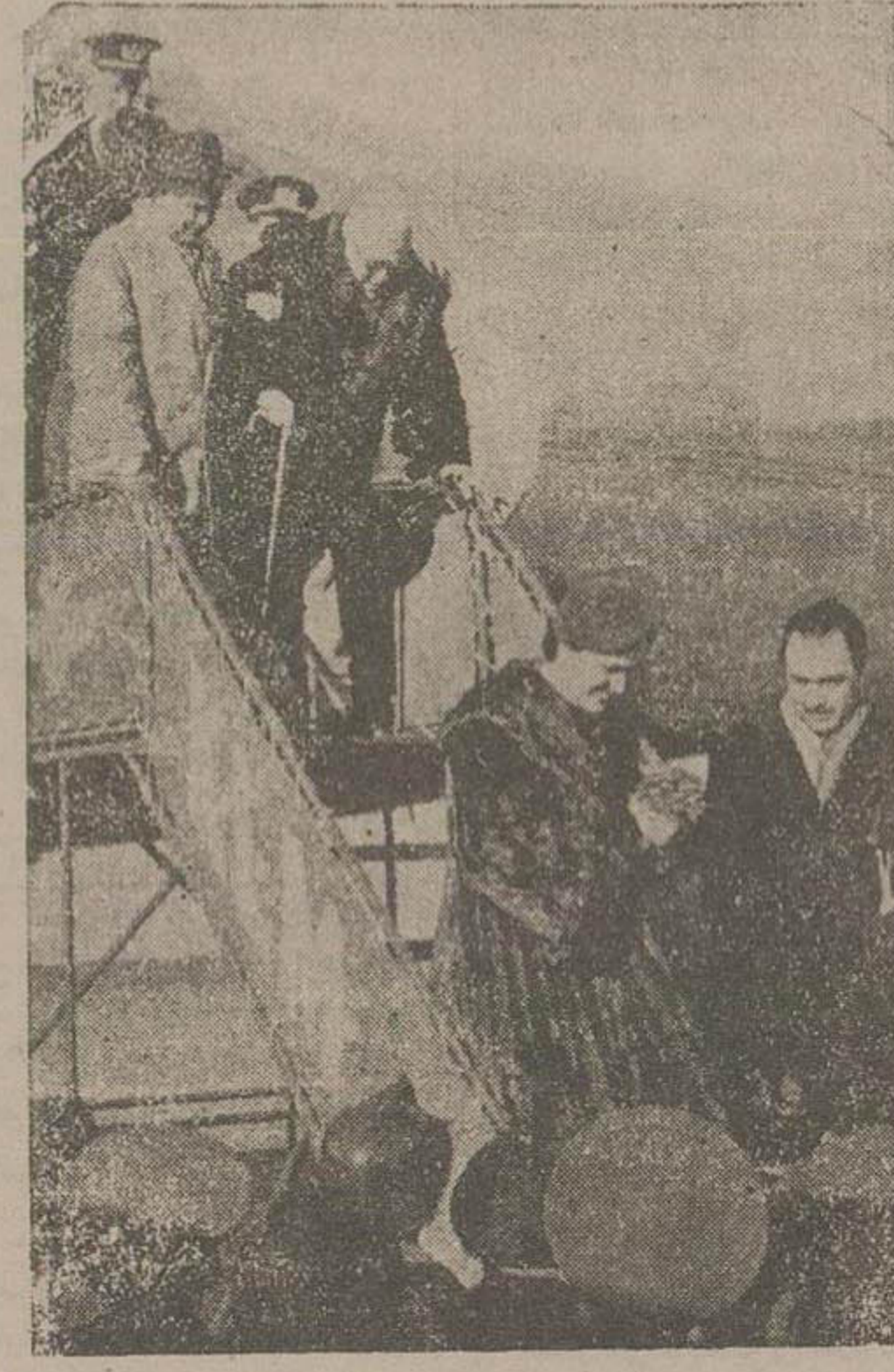
مناظره در روز اطلاع دادیم حضرت والا آقاخان در روز بعد از ظهر با هوایا وارد تهران شدند...