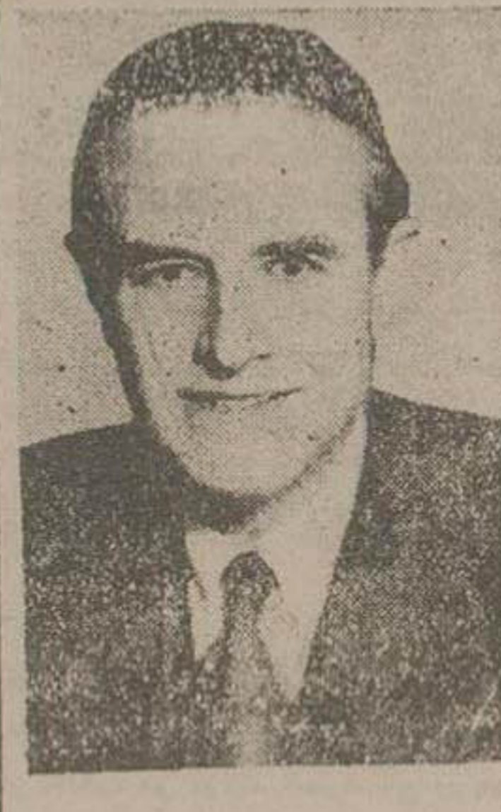
هریمن معاون ترومن

همه جا باید با کمونیسم جنگید امریکا طالب یک آسیای بزرگ و مستقل است تهران آماده شانمانی است