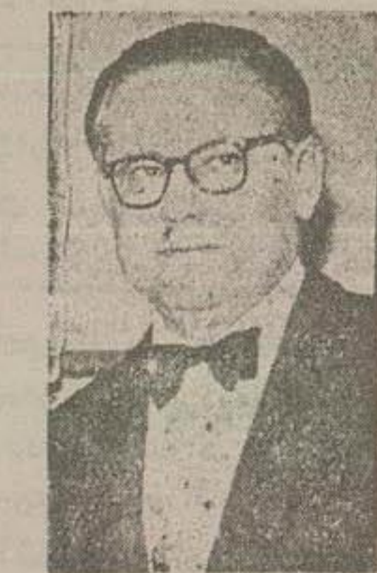
شرح در صفحه دهم