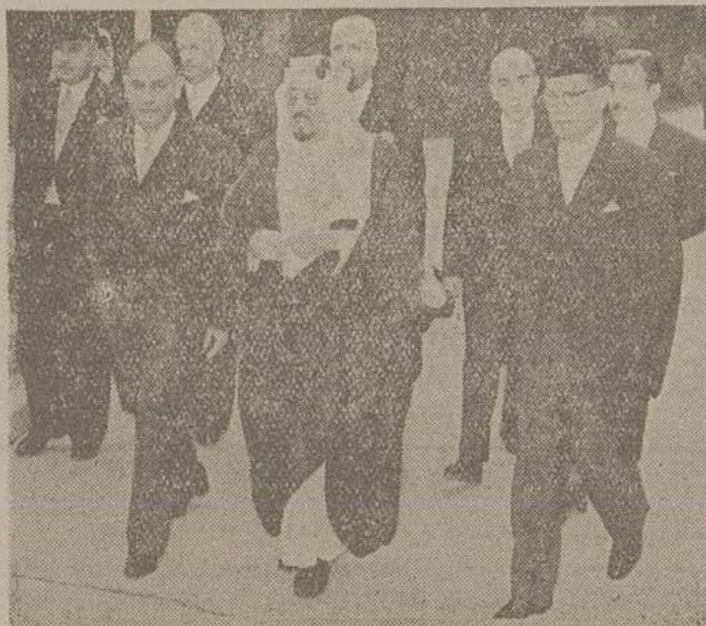
مقرا و نمایندگان کشورهای اسلامی هنگام ورود بخاک مرم شرح در صفحه دوازدهم

بیانات آقایان تقی زاده و نورالدین امامی آقای تقی زاده گفت: خداوند تبارک و تعالی این مملکت را از افراطها و تفریطهای چپ و راست و انقلابات نامطلوب حراست فرماید