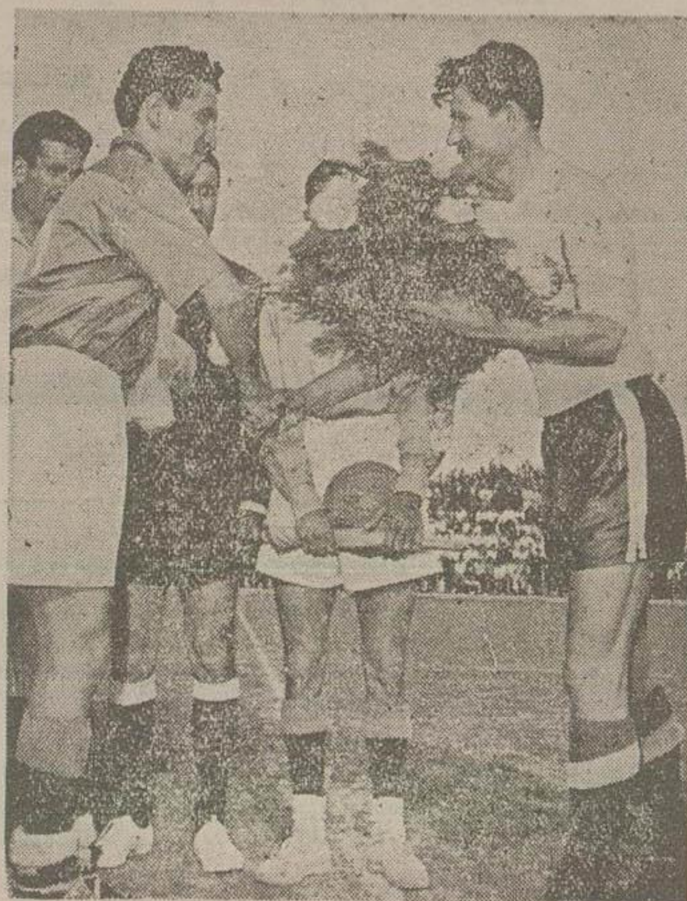
کابینان های تیم تهران و آنکارا دسته کل یکدیگر میدهند

دیروز صبح آقای دکتر امینی وزیر دارائی از طرف اعلیحضرت همایون شاهنشاه بوزارت دادگستری منصوب و پس از معرفی بمحور ملوکانه از امروز در وزارت دادگستری مشغول کار شد. این انتقال مسبقاً بسوابقی است که جریان آن اینک از نظر خوانندگان