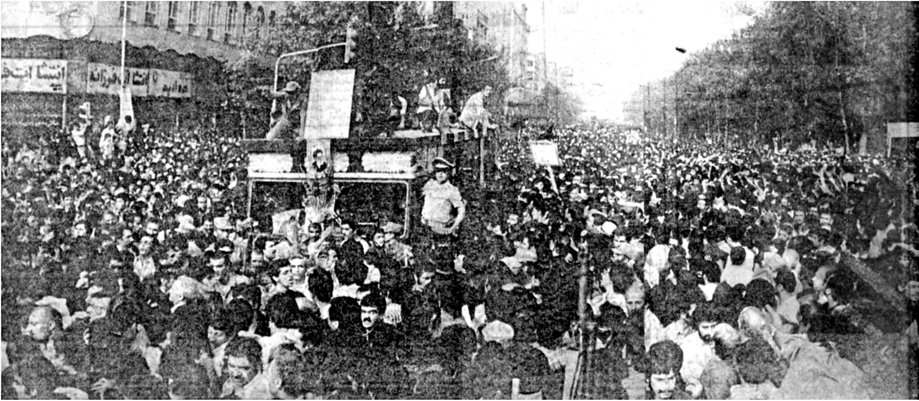
سپاس ملتی ازاده، از رهبری بزرگ و از روحانی انقلابی‌ای که سراسر عمرش را وقف مبارزه با استبداد و استعمار و ارتجاع کرده بود.