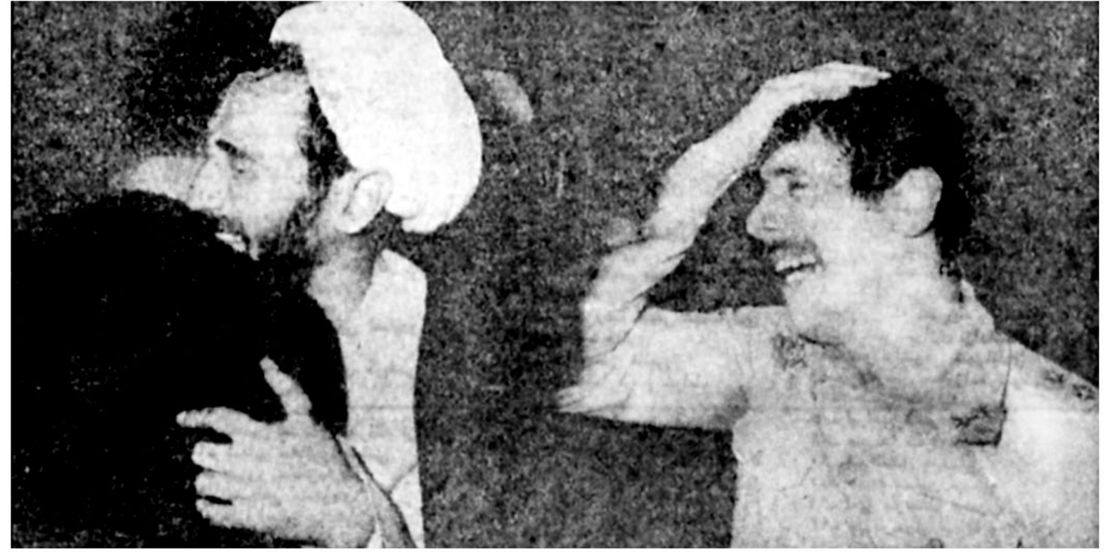
مردم تهران، نه، مردم سراسر ایران، از سحرگاهان که خبر درگذشت پدر طالقانی را شنیدند برسر زدند و برسینه کوفتند. مرد وزن پیرو جوان، نظامی و روحانی در هجرت بی بازگشت رهبر به سوگ نشسته اند.