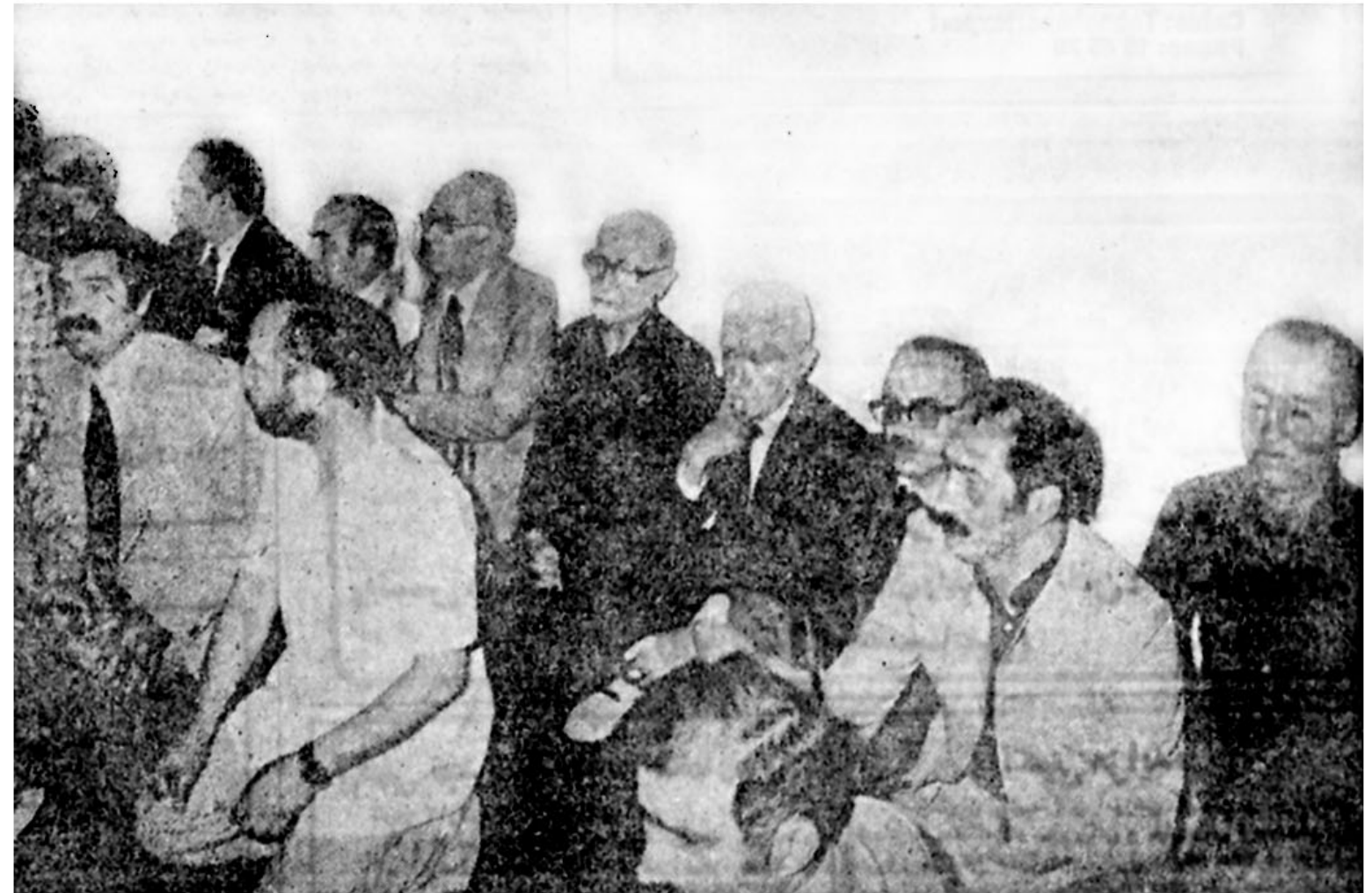
هنوز دقائق چندانی از پیوستن مجاهد نستوه به ملکوت اعلی نگذشته بود که یاران دیرین و هم‌زمان پیکیر او در کنار پیکری جانش گردامندند. مهندس بازرگان، همراه، هم‌رزم و هم‌بند سالیان دراز مبارزه و حبس و تبعید او، و نیز میناچی وزیر ارشاد ملی و فروهر وزیر کار کثیرانی وزیر مسکن و شهرسازی از آنجمله بودند.