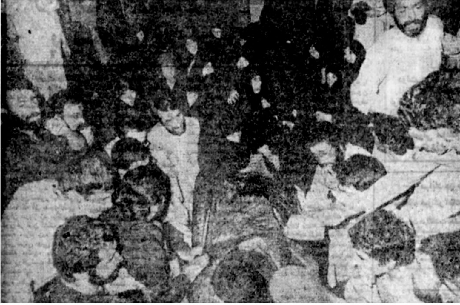
این تنها دختران طالقانی نیستند که آخرین بار، با پدر بزرگوار خود وداع می کنند، او پدر همه دختران و زنان مبارز و مجاهد و پیشوای همه مردم انقلابی بود.