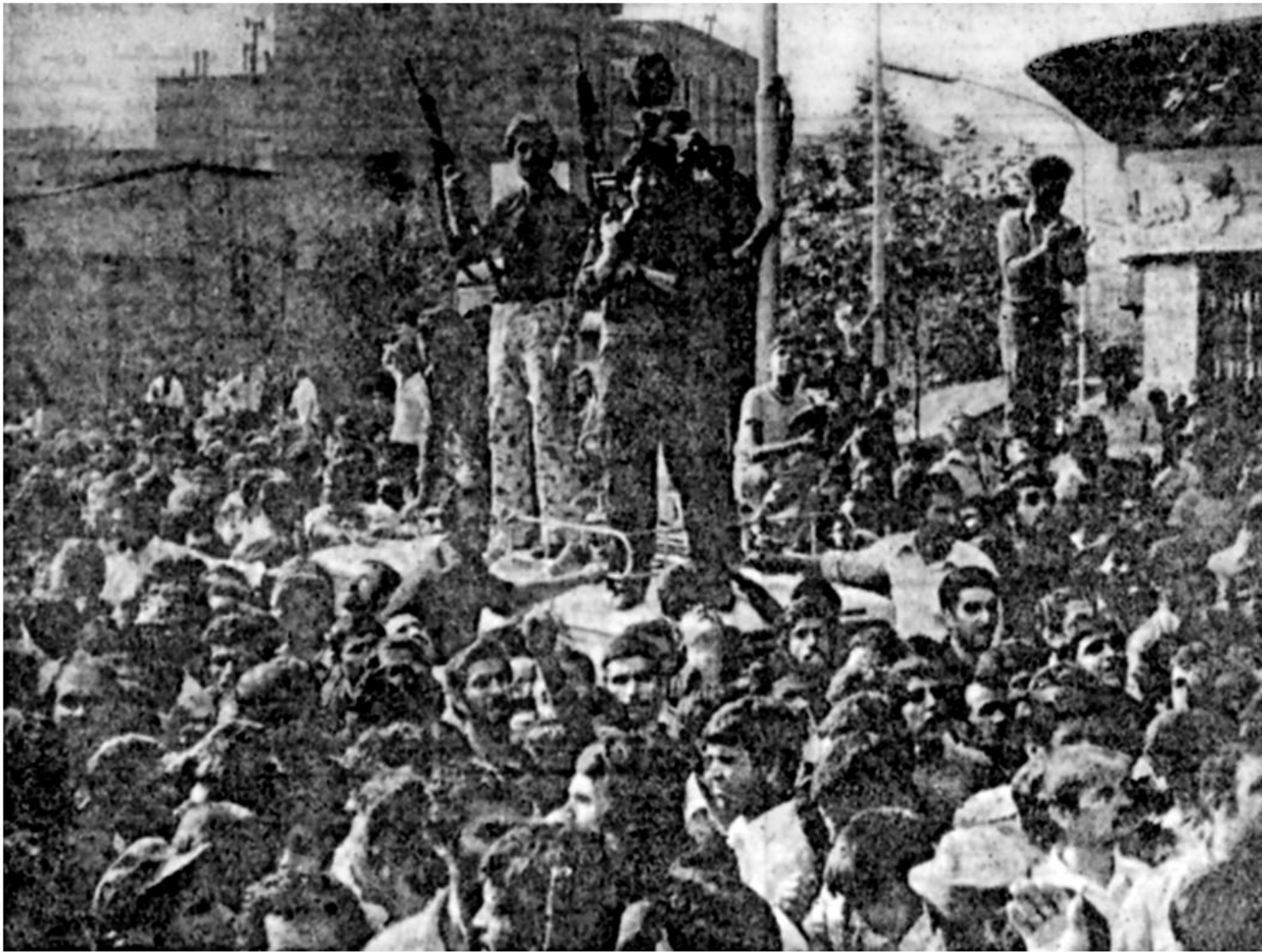
جانبازان انقلاب، فرزندان راستین این مجاهد نستوه، با چشمانی اشکبار و سلاح برکف پدر طالقانی را تا منزل ابدیش بدرقه می‌کنند.