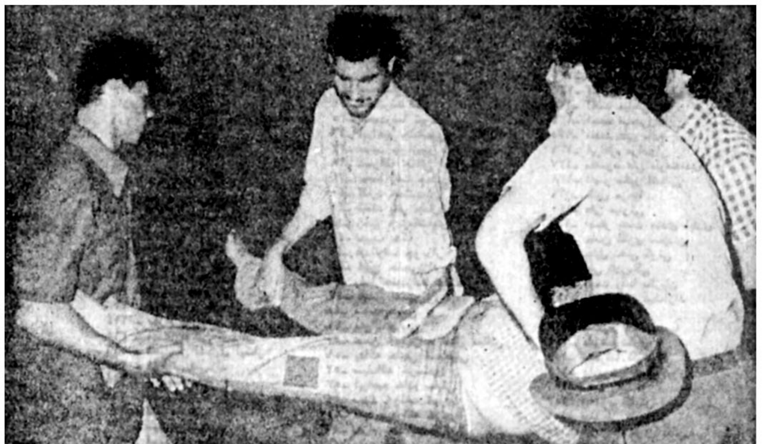
انبوه جمعیت، التهاب و هیجان و تاثیر مردمی که در ماتم از دست دادن پیشوا و معلم و رهبری به عظمت و بردباری و مهربانی «پدر طالقانی»، ضعف و بیپوشی عده ای را بدنبال داشت. دیروز نظیر چنین صحنه هایی در فاصله ۲۴ کیلومتری دانشگاه تهران تا بهشت زهرا زیاد چشم می خورد.