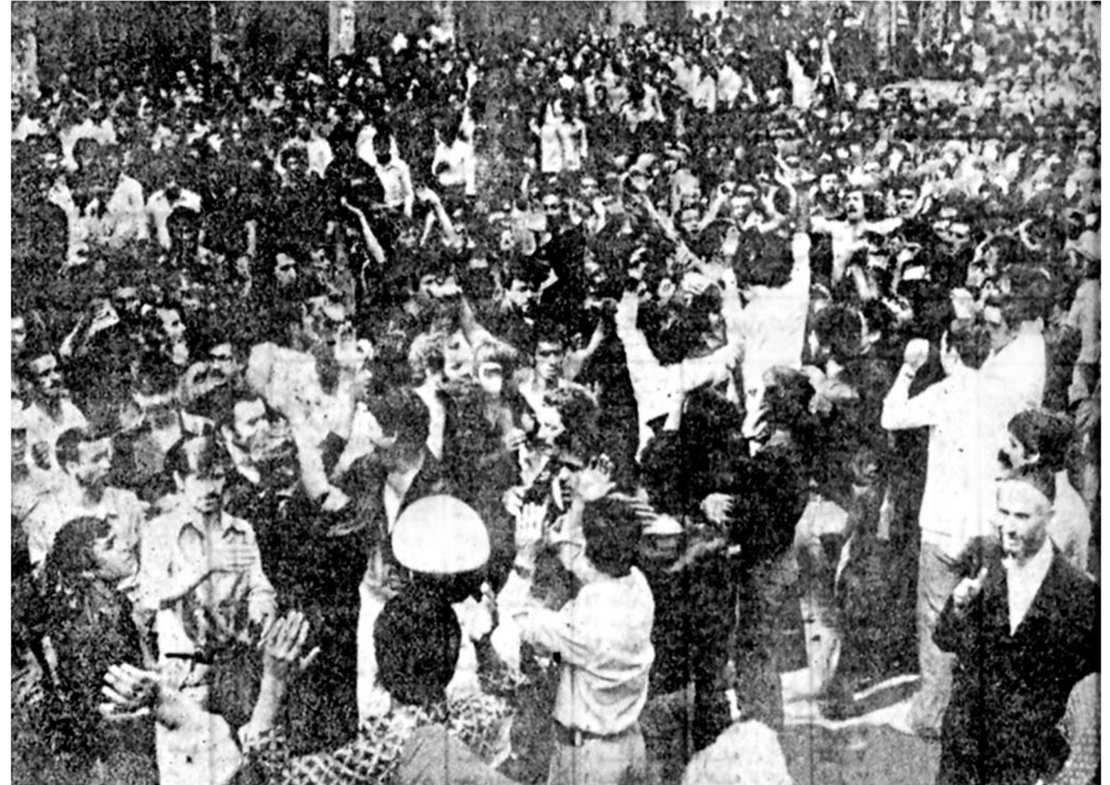
طالقانی، طالقانی، راهت ادامه دارد سحرگاه دیروز با این فریاد آسمان‌سای مردم ازاده‌ای که از نخستین ساعات درگذشت مجاهد نستوه در اطراف منزلش جمع شده بودند، تهران از خواب بیدار شد. فریادی که شامگاهان از سراسر ایران بگوش می‌رسید.