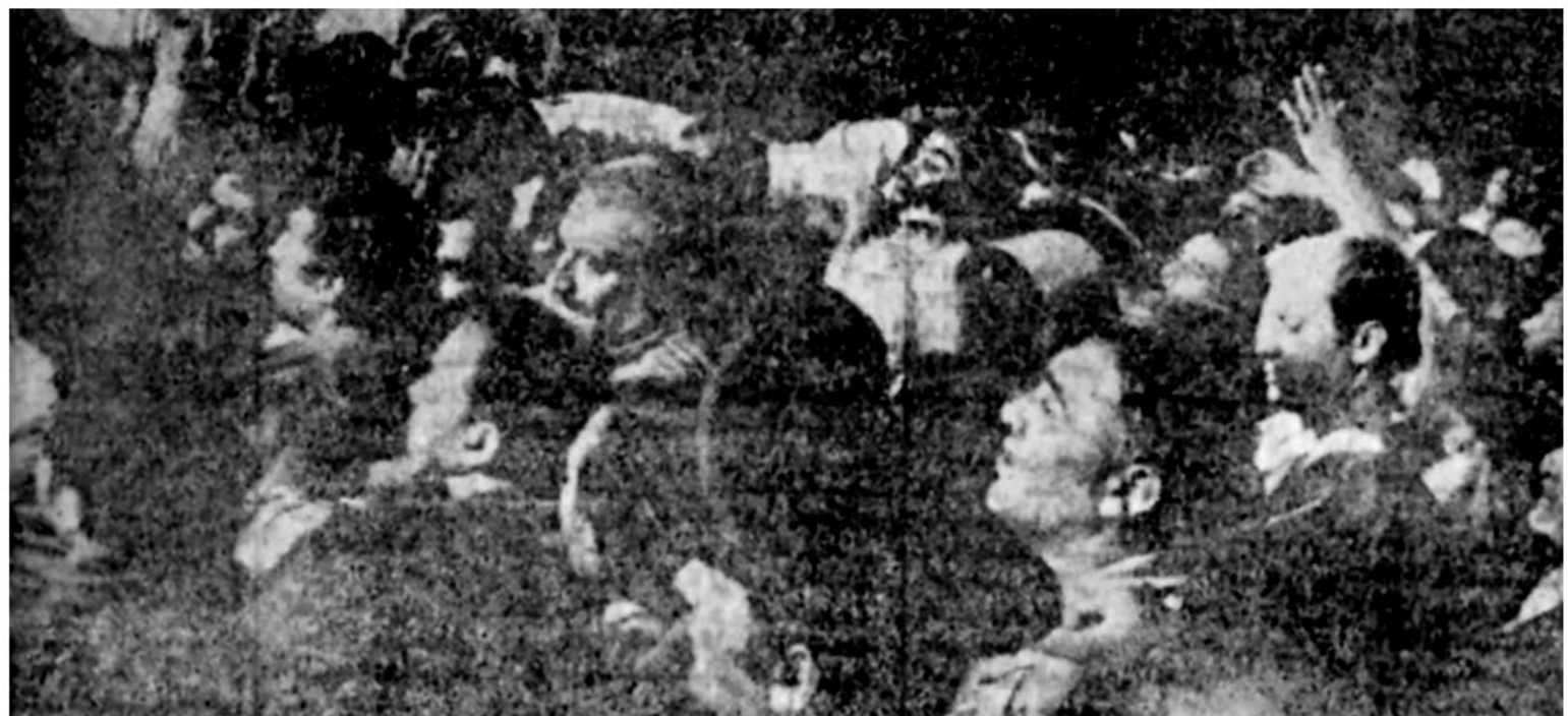
الله اکبر... الله اکبر... لاله الاالله... این فریاد آسمانی طغوت شکن که پایه های رژیم جبار را به لرزه در آورده بودند، دیروز بدرمه راه مجاهدی بزرگ و مبارزی نستوه بود که فریادش علیه پیدای رژیم انعکاس صیحه جوانان رزمنده در شکنجه گاهها و میدانهای تیر بود.