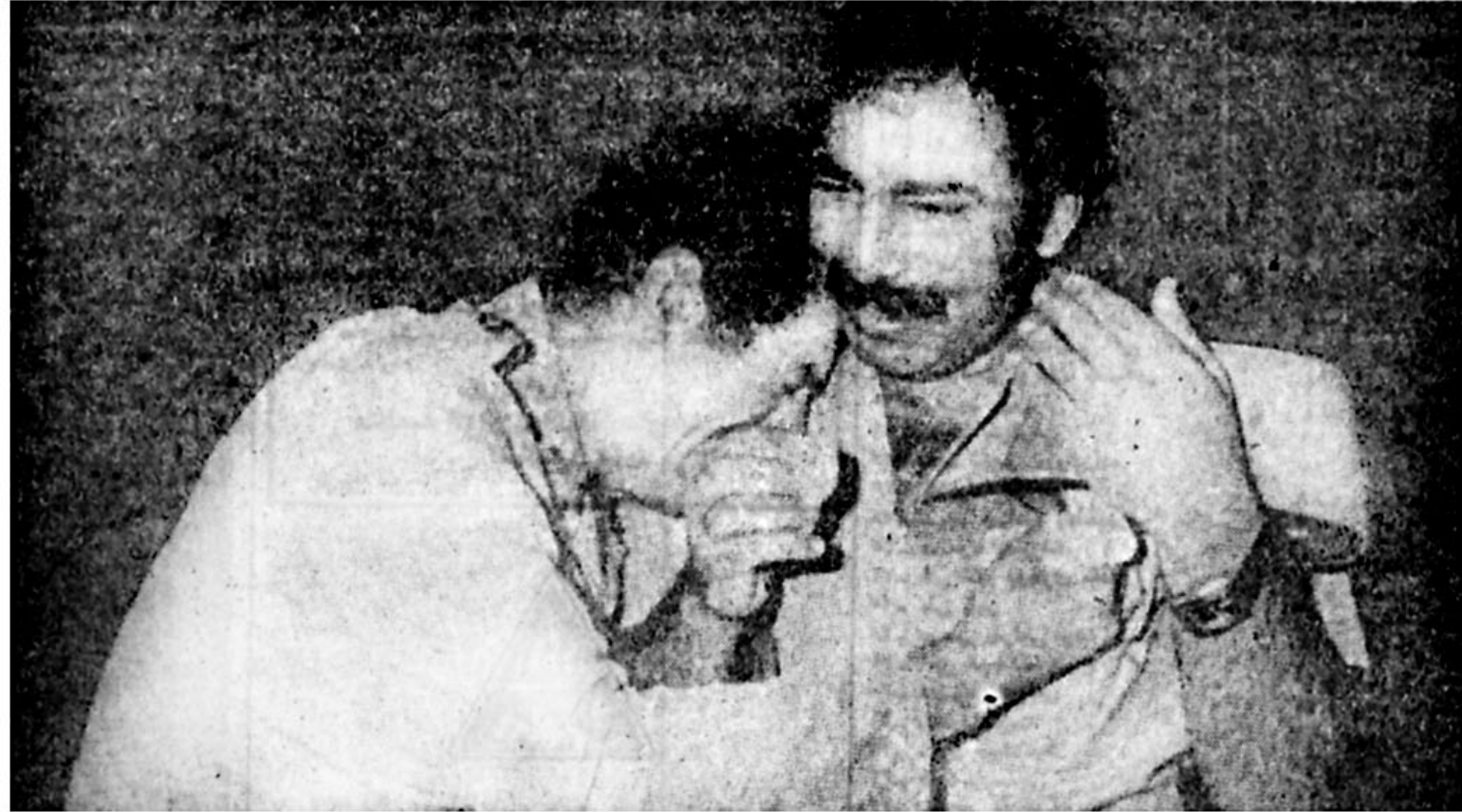
در خیابانها، در کوچه ها، در منزل و اداره، هر جا که خبر درگذشت انقلابی فساد ناپذیر و مجاهد خستگی ناپذیر دهان به دهان می گشت، سیل اشک از دیدگان جاری می شد که گونی ملت، عزیزی از نزدیکترین عزیزانش را از دست داده است.