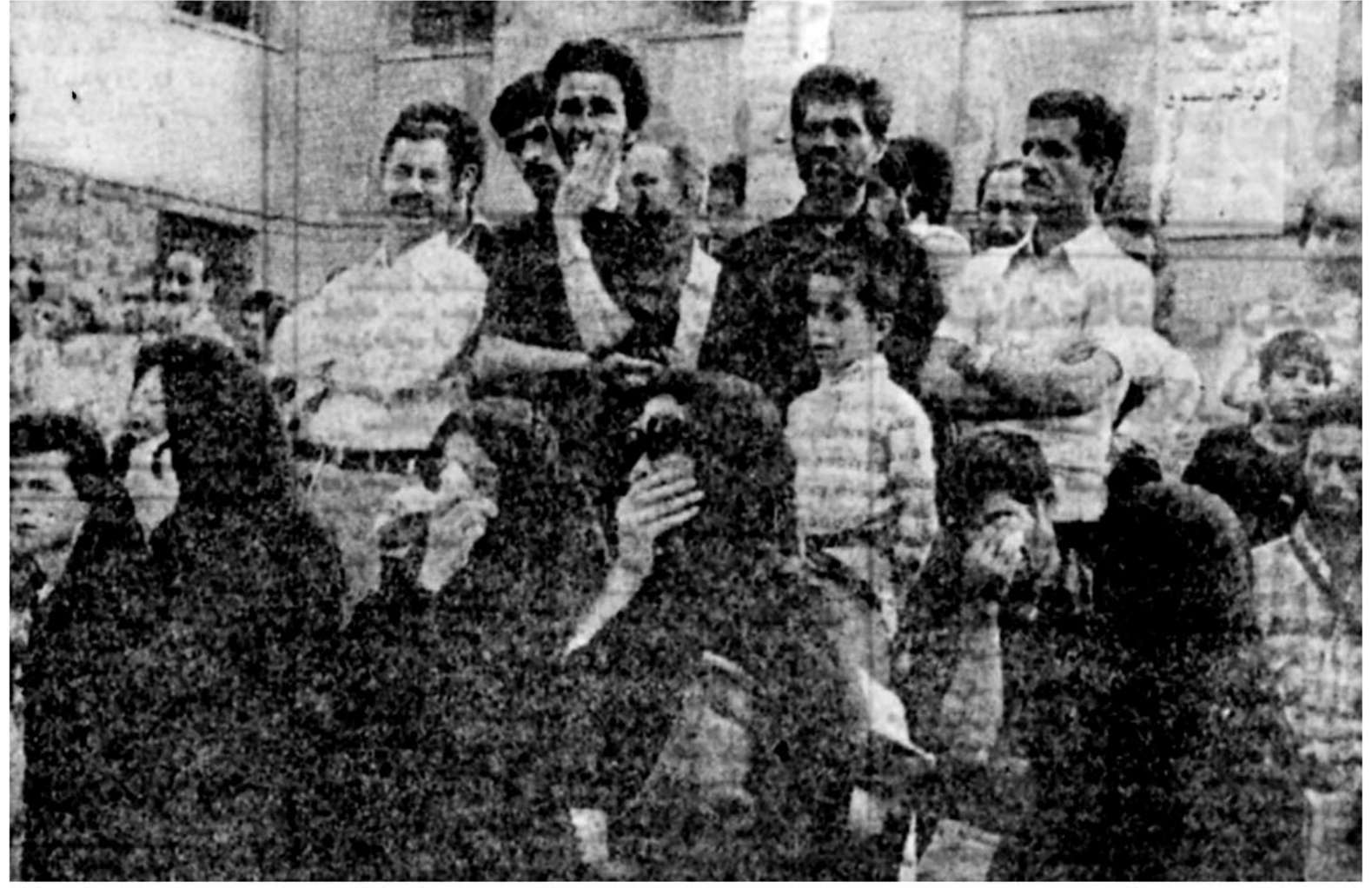
این زنان و مردان سپاهپوش، که اینسان می گردیدند، در غم از دست دادن رهبری توانا، مبارزی بزرگ، انقلابی ای راستین و پدري مهربان به سوگ نشسته اند. دیروز، در هر گوشه و کنار تهران، چنین صحنه هایی فراوان چشم می خورد.