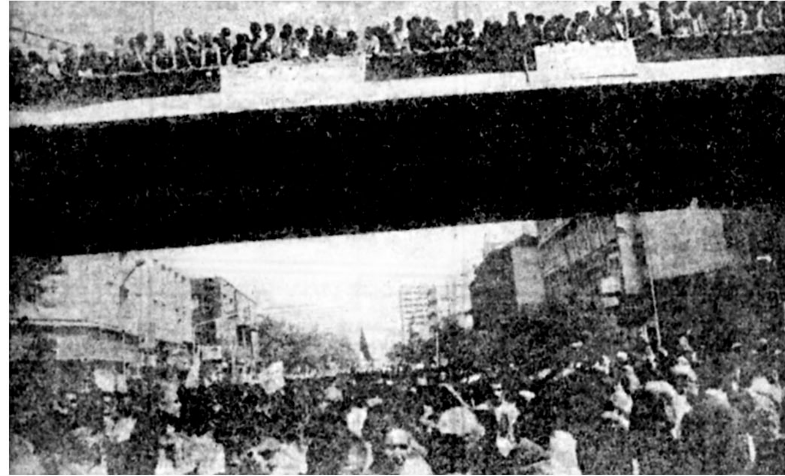
از چمن سپاهپوش دانشگاه تهران تا دنیای بهشتی شهیدان بهشت زهرا، گونی به احترام درگذشت «انقلابی پیر» و مجاهدات وقفه ناپذیرش فرشی انسانی گسترده اند. تهران، تاکنون چنین سیل خروشان انسانی کمتر دیده دارد.