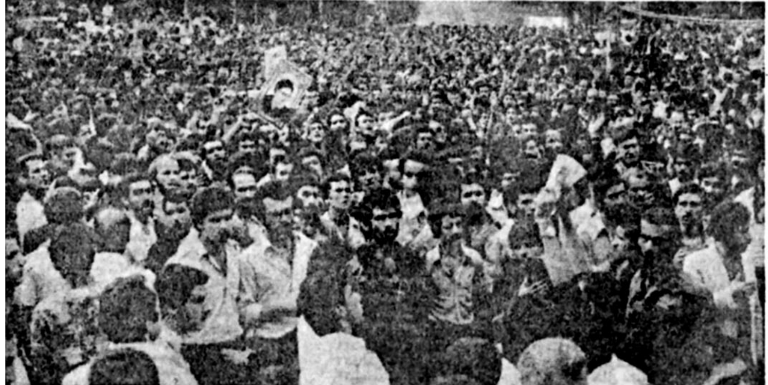
جمعیت، آرام، مبهور و خوددار، به سخنان یکی از همزمان قدیمی آیت الله طالقانی گوش می دهد. در چهره های مصمم جوانان به وضوح می توان چنین خواند: راه انقلاب، راه مبارزه با استبداد، راه طالقانی تا پایان ادامه دارده.