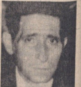
بعد از ظهر در روز «کلنل» آخرین برنامه خود را از تلویزیون تماشا کرد صفحه ۱۱۹

اگر مذاکرات نفت به نتیجه نرسد سفر شاهنشاه به خارج منتفی می شود