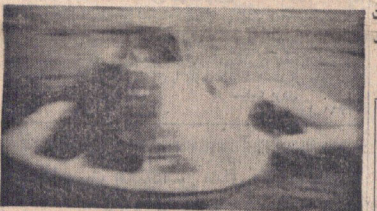
این عکس پس از فرود آمدن کاپیتان حامل ۳ سرشین آپولو ۱۴ در اقیانوس آرام گرفته شده است.

فضانوردان در ساعت مقرر سلامت در اقیانوس آرام فرود آمدند در صفحه ۲