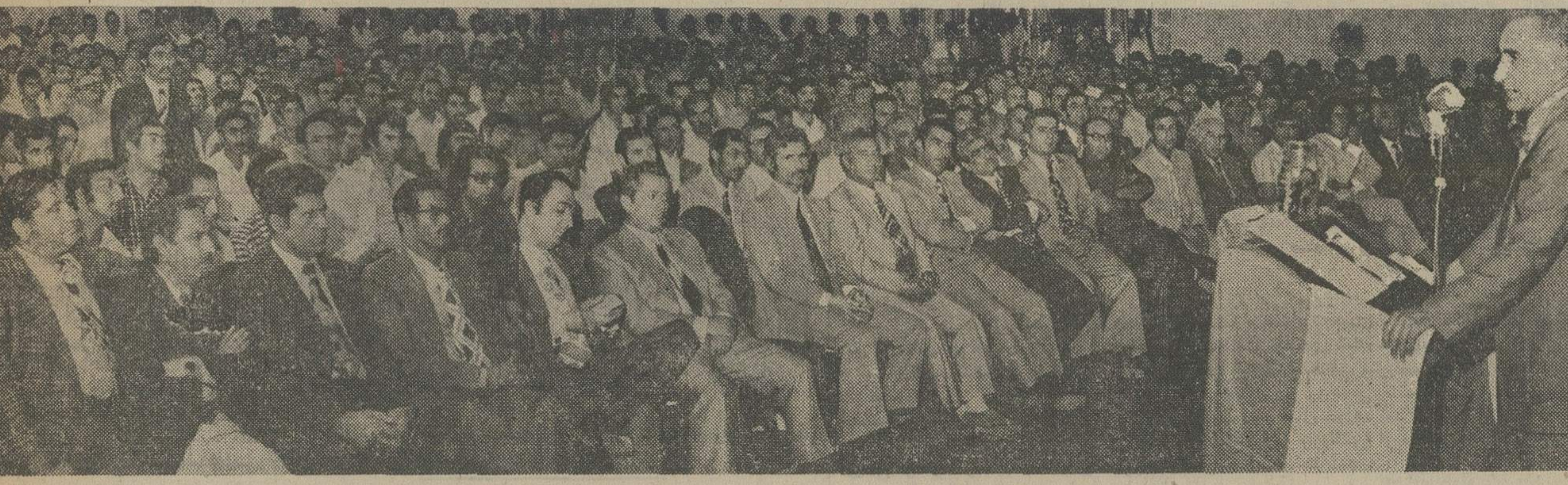
در اجتماع بزرگ اصناف تهران پارس، فروشندگان و مصرفکنندگان رودرویم قرار گرفته و بیامون مبارزه باگرانفروشی به تبادل نظر پرداختند.

فردستی در سابق مظهر صداقت است، اصناف، امانت و اعتبار بود. نتوان پوشیده داشت که افرادی هستند که دیر آمده اند و میخواهند زود بروند، اینها دکان را با سر گرفته به اشتباه گرفته‌اند، همین عده هستند که با تجاوز و اجحاف بمصرف کنندگان در راه برنامه های رفاهی دولت اخلال میکنند، مملکت آنچنان توسعه‌ای پیدا کرده است که به افراد سودجو فرصت نخواهد داد به غارت خود ادامه دهند. من خودم دلم نمیخواهد غارتگرانه درآمد به جیب عده ای سودجو سرازیر شود. معاون اتاق اصناف افزود: مصرف کننده چه کسی است؟ متعلق به چه قشری است تهران ۲۰۰ هزار واحد صنعتی دارد، اگر هر فردی صرفاً با احتساب خانواده اش ه نفر حساب کنیم یک میلیون نفر از سه میلیون جمعیت تهران مربوط به خود اصناف هستند، هر فرد صنعتی یک یا ده قلم کالا میفروشد اما هزار قلم کالا خریداری میکند. اینها را با احتساب تمام واحدهای صنعتی در تهران که حدود ۲۰۰ هزار واحد صنعتی دارد، اگر هر فردی صرفاً با احتساب خانواده اش ه نفر حساب کنیم یک میلیون نفر از سه میلیون جمعیت تهران مربوط به خود اصناف هستند، هر فرد صنعتی یک یا ده قلم کالا میفروشد اما هزار قلم کالا خریداری میکند. اینها را با احتساب تمام واحدهای صنعتی در تهران که حدود ۲۰۰ هزار واحد صنعتی دارد، اگر هر فردی صرفاً با احتساب خانواده اش ه نفر حساب کنیم یک میلیون نفر از سه میلیون جمعیت تهران مربوط به خود اصناف هستند، هر فرد صنعتی یک یا ده قلم کالا میفروشد اما هزار قلم کالا خریداری میکند.