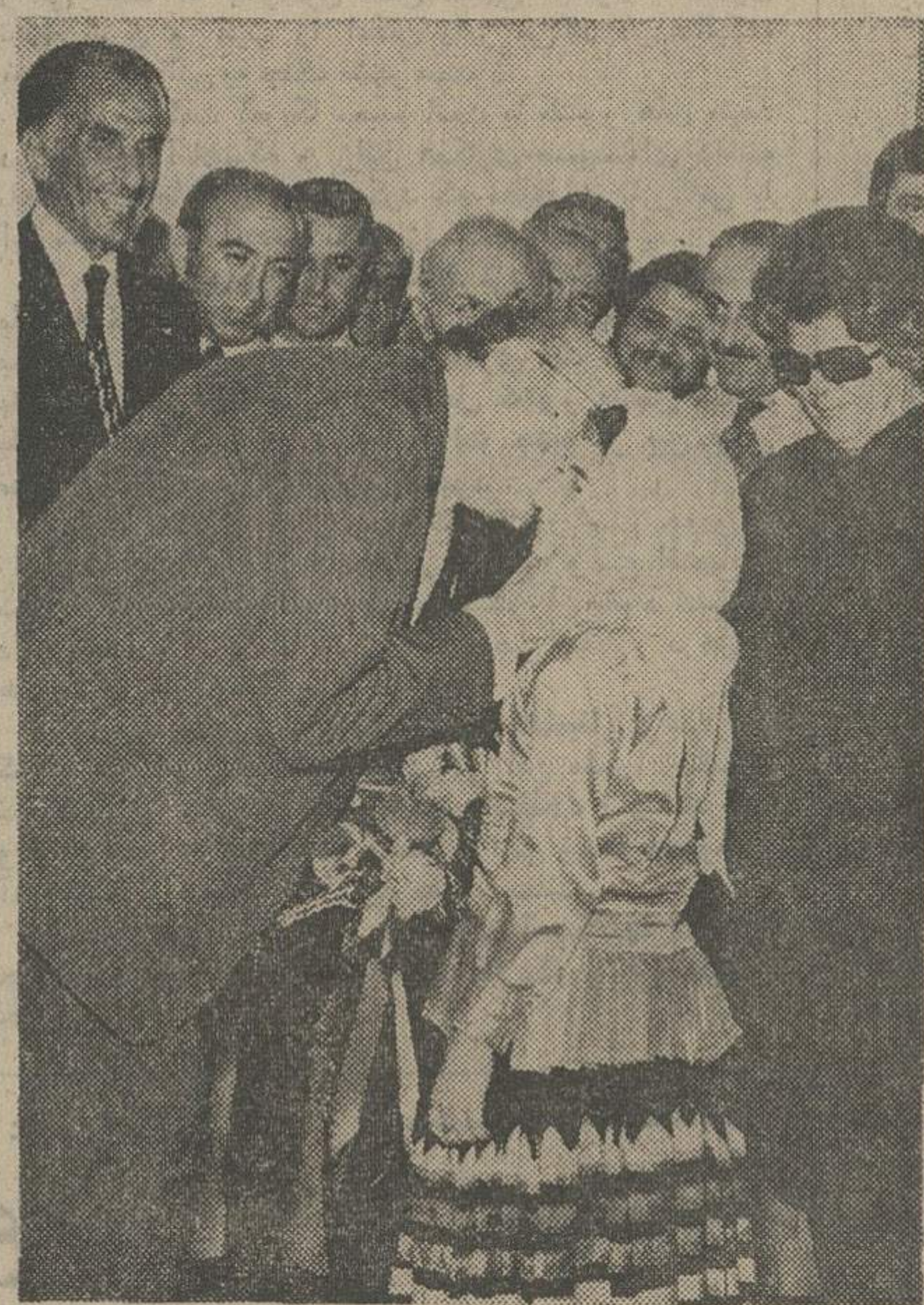
آقای هویدا نخست وزیر هنگام ورود به نمایشگاه گیلان با استقبال گرم گیلانی ها مواجه شد. در عکس، نخست وزیر در حال بوسیدن دختر بچه ای که ضمن خیر مقدم به ایشان دستگیری داد دیده می شود.

فورد از برزنف و سادات خواست هر چه زودتر به امریکا بروند