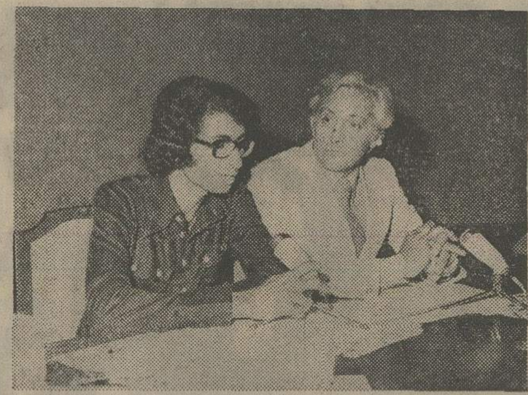
دکتر کاوسی : آدمهای منفی باف در هر جشنواره ای حضور دارند.

در دومین روز جشنواره فیلمسازان جوان، دوامه یکی از بهترین فیلمهای جشنواره به نمایش درآمد. دوامه ساخته حسن بنی هاشمی یکی از فیلمسازان جوان است که تاکنون موفقیتهای زیادی در کار فیلمسازی کسب کرده است.