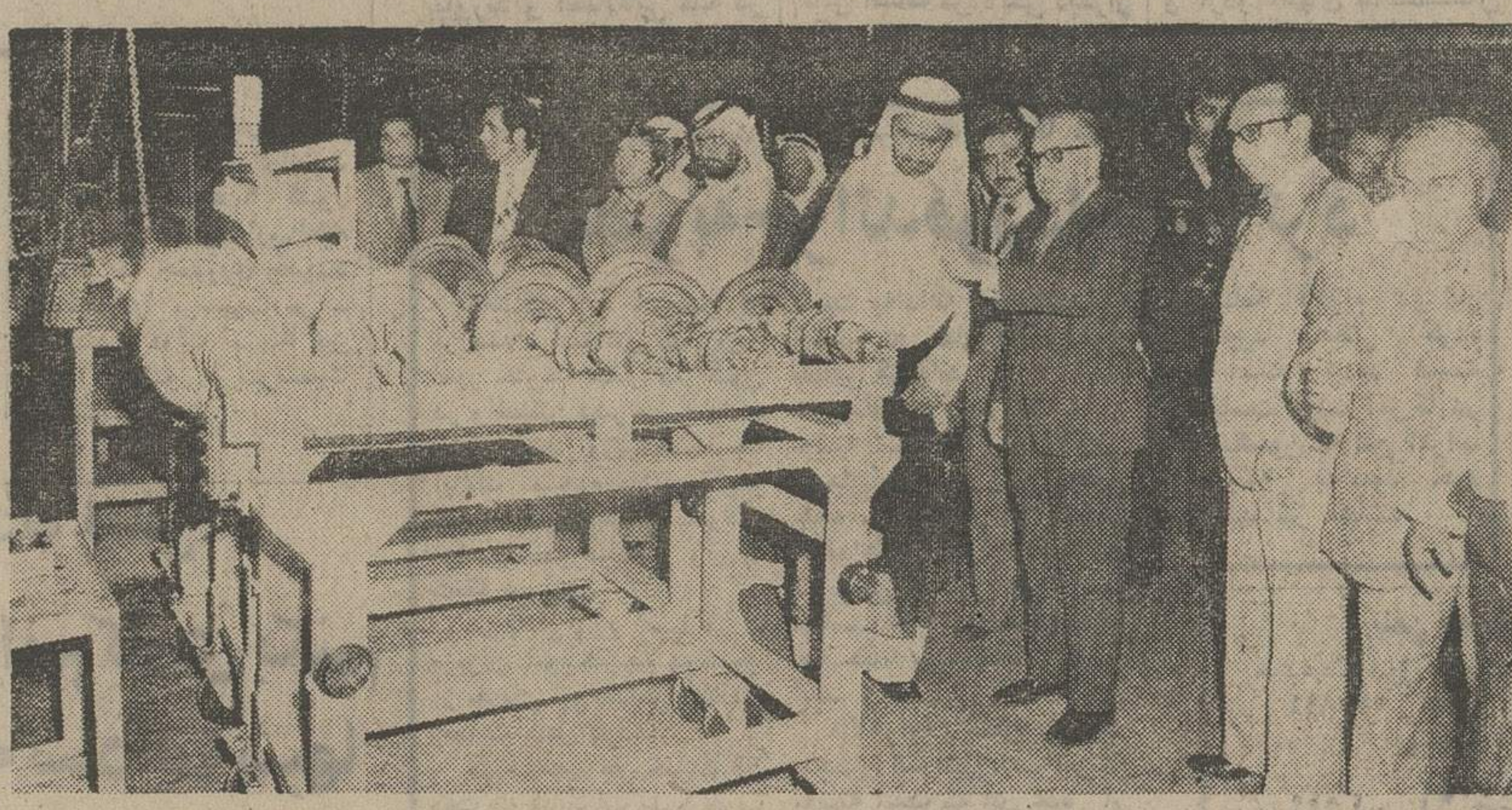
بازدید والاحضرت شیخ راشد از کارخانجات ایران ناسیونال

مینی بوس و پروژه موتور و همچنین قسمت لوازم بدکی بازدید نمودند. دقت عمل و نظم کار در ایران ناسیونال مورد توجه حکمران دوبی قرار گرفت و ایشان بيشرفت های سریع این واحد صنعتی را ستودند.