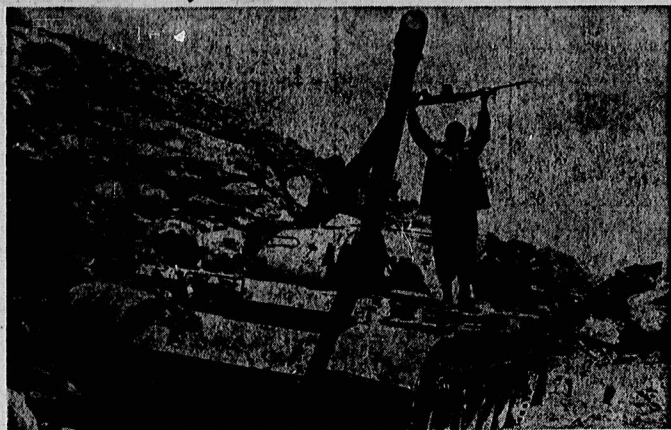
در حملات گسترده عراق به پاسداران ارتش و نیروهای مردمی عراق در جبهه‌های غربی، ارتش عراق در جبهه‌های شرقی و جنوبی شکست خورد. در این نبرد گسترده عراق به برتری خود در تانک‌ها و موشک‌ها متکی بود. ارتش عراق در جبهه‌های شرقی و جنوبی شکست خورد. در این نبرد گسترده عراق به برتری خود در تانک‌ها و موشک‌ها متکی بود.