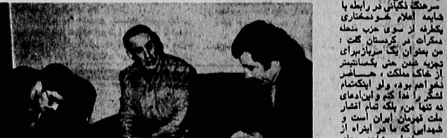
سخنرانی دکتر چمران در این نمازخانه اهواز:

سخنرانی دکتر چمران در این نمازخانه اهواز: ما باید بدانیم که این کشتارها، به خاطر چیست؟ ما باید بدانیم که این کشتارها، به خاطر چیست؟ ما باید بدانیم که این کشتارها، به خاطر چیست؟