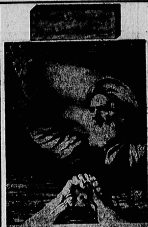
دولت ایران با کویته سوریه پروستر چهارمک امام امت را امروزاز روزنامه فروشیدبا بخواید

امریکا و عراق می کوشند ایران را سر میز مذاکره بنشانند در صفحات ۱۲ و ۱۳